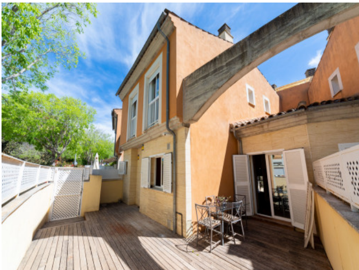
Sonnterrasse mit Sitzgelegenheit