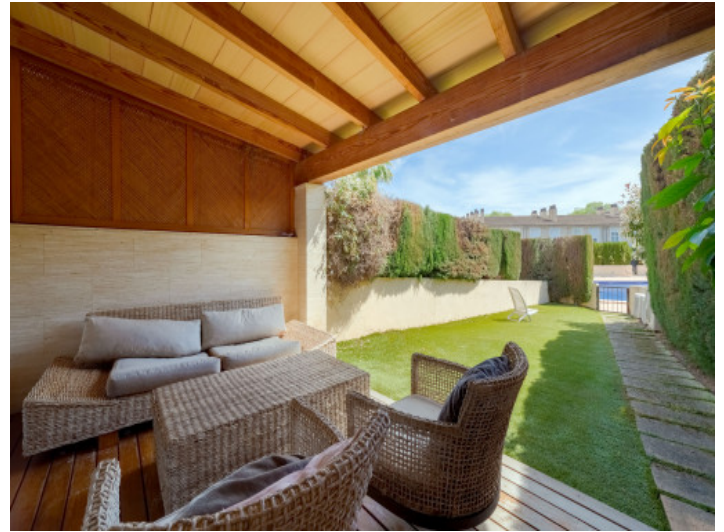
Überdachte Terrasse mit Garten