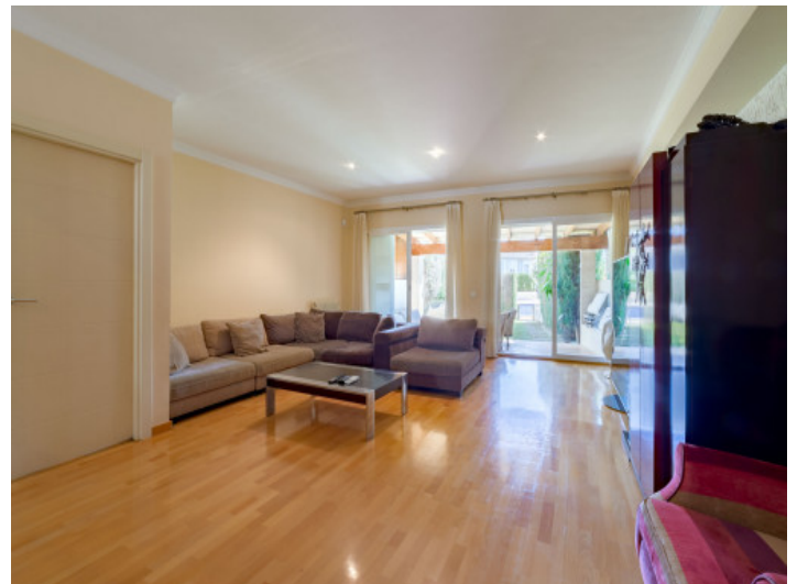
Wohnzimmer mit Terrassenzugang