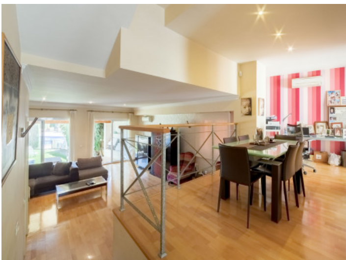
Esszimmer mit Arbeitsbereich