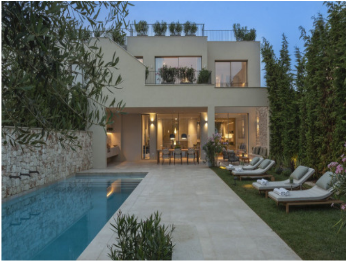
Haus am Abend