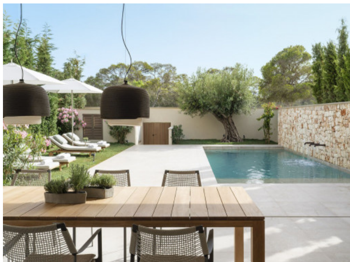
Pool und Terrasse