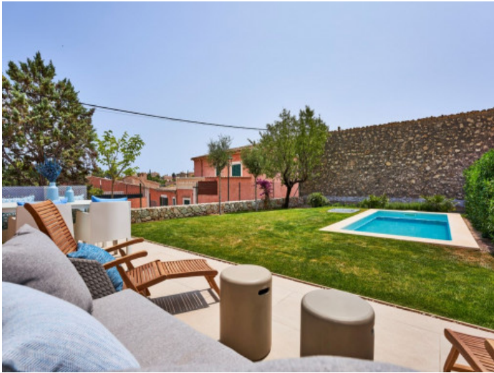
Garten mit Pool