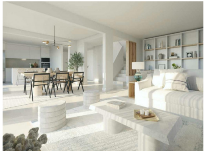
Offener, heller Wohn-/Essbereich