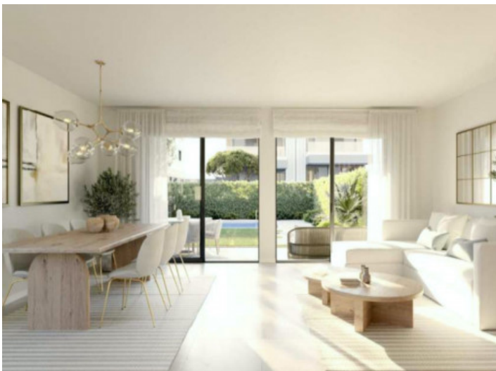
Wohn-/Essbereich mit Poolblick