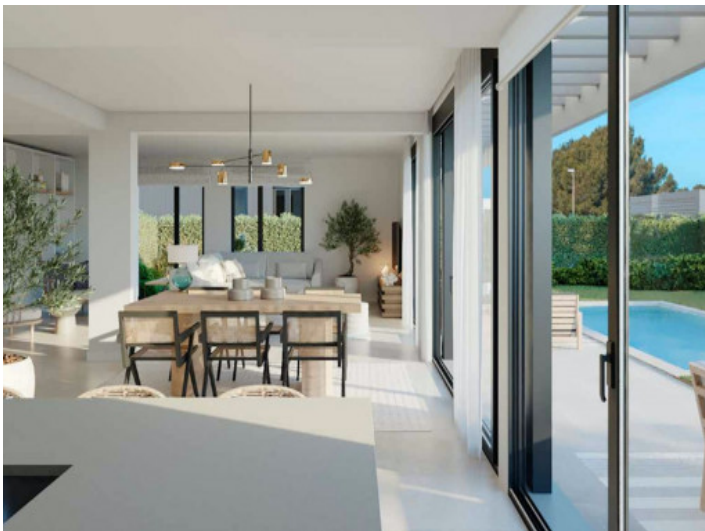
Wohn-/Essbereich mit Terrassenzugang