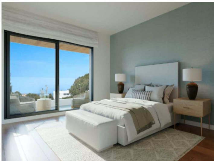
Eines von 4 Schlafzimmern