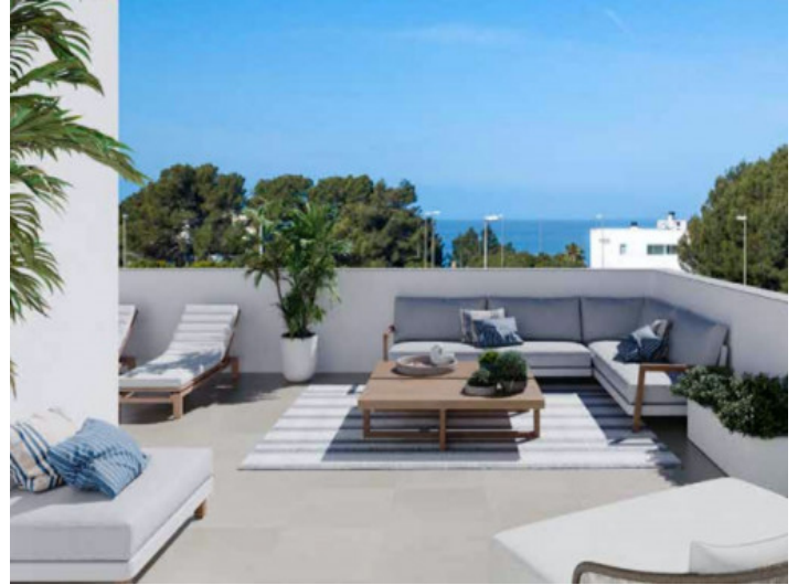
Dachterrasse mit Meerblick