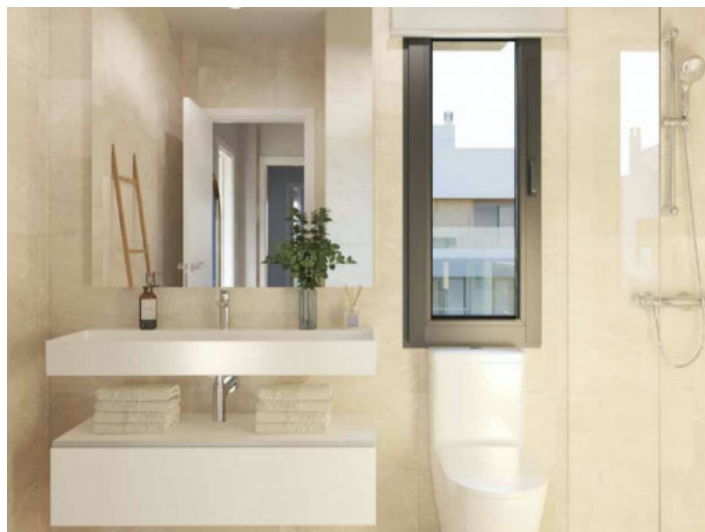
Eines von 3 Badezimmern