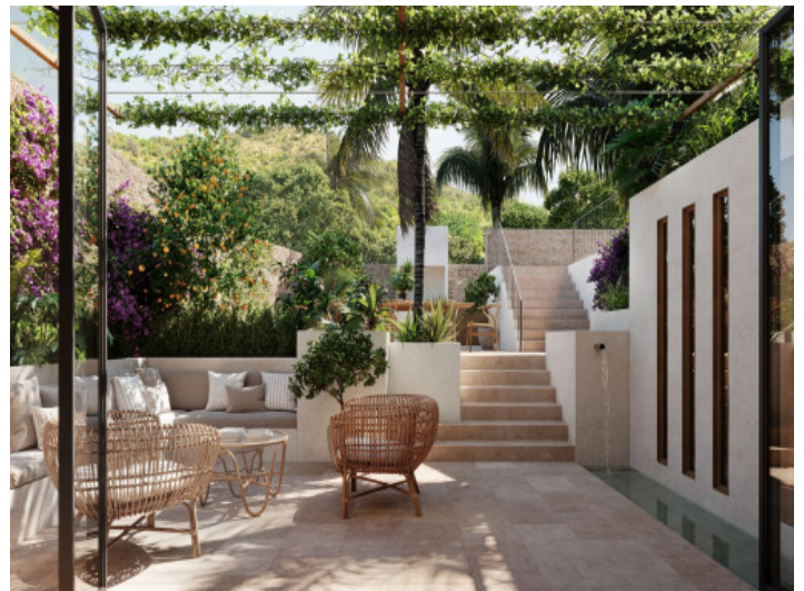
Schön angelegte Terrasse