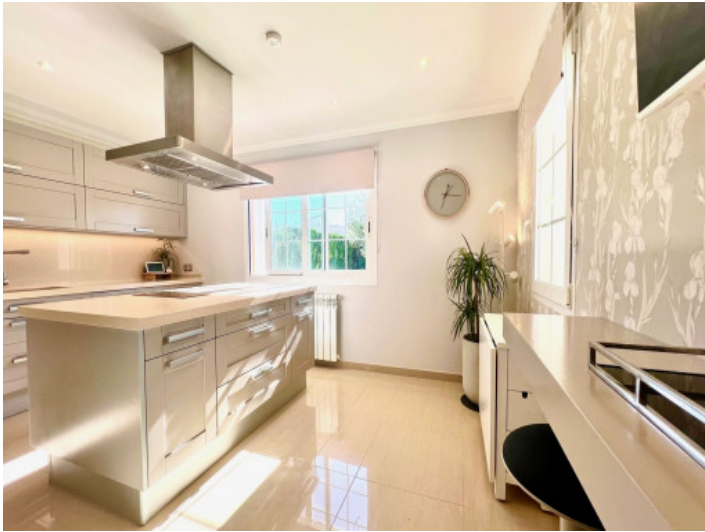
Moderne Küche mit Kochinsel