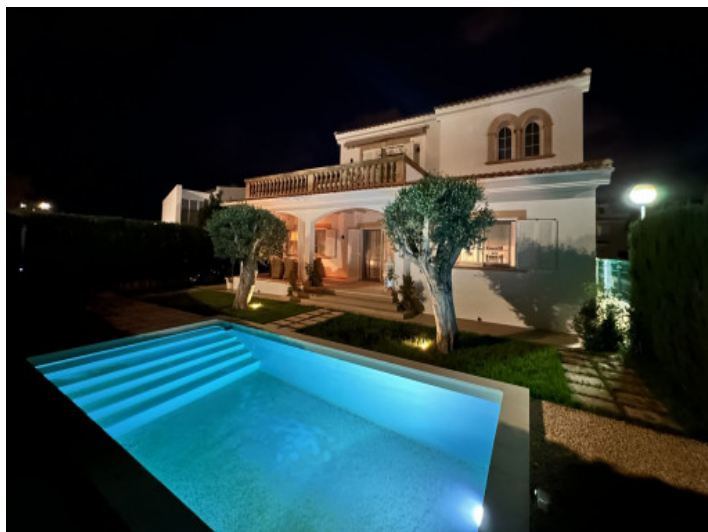
Außenansicht bei Nacht