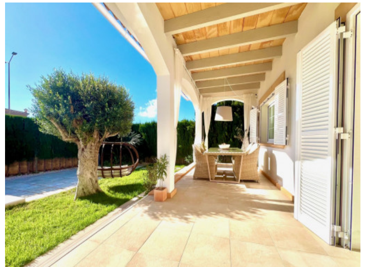
Überdachte Terrasse mit Gartenblick