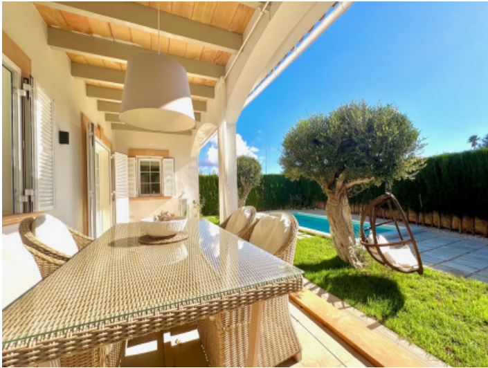
Überdachte Terrasse mit Essbereich