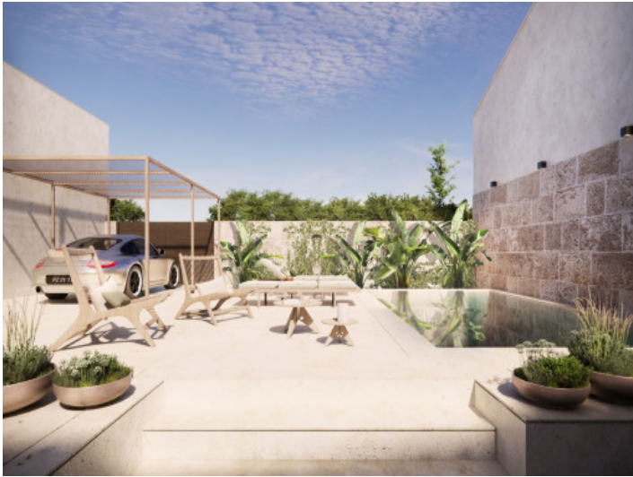
Poolbereich mit Sonnenterrasse