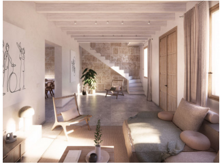
Eingangs- und Wohnbereich