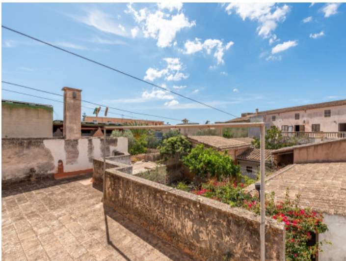
Aussicht von der Terrasse