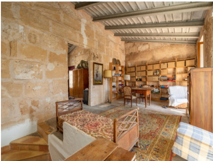
Galerie 1. Etage