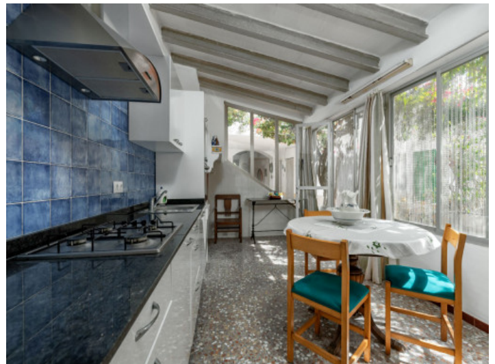
Eine weiter Küche