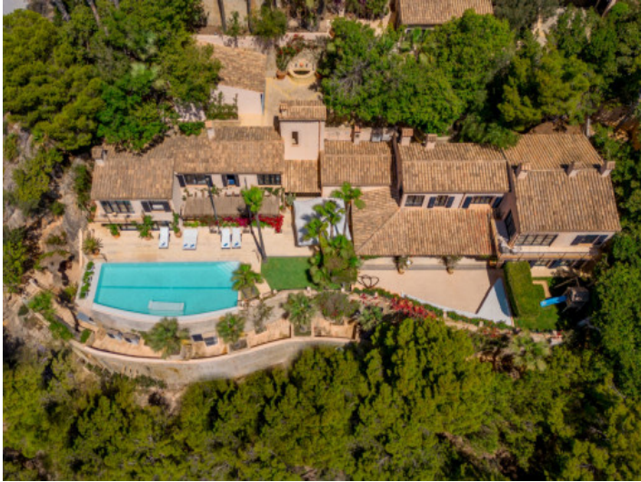
Ansicht auf das Anwesen