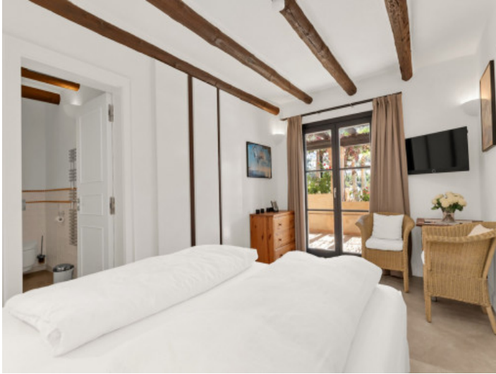
Ein weiteres Schlafzimmer