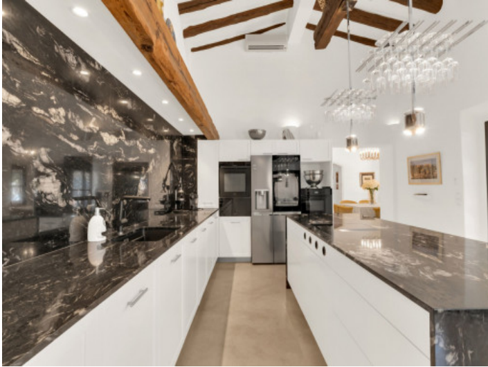
Elegante vollausgestattete Küche