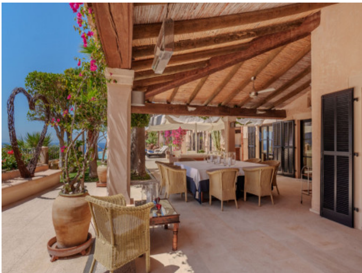
Große überdachte Terrasse