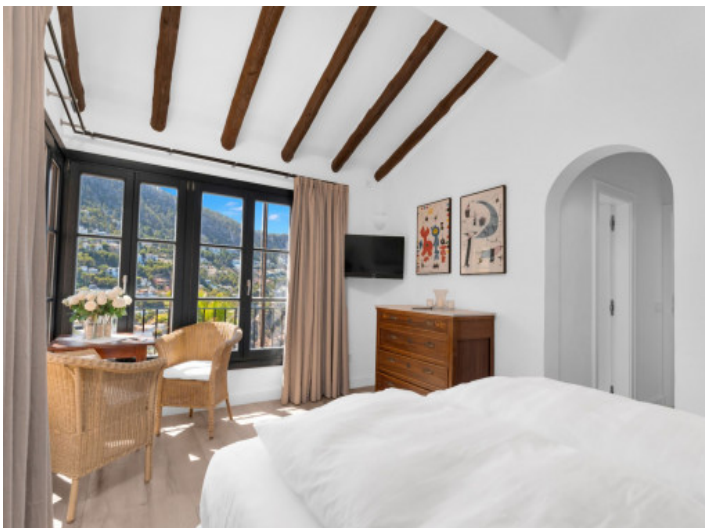
Schlafzimmer mit Meerblick