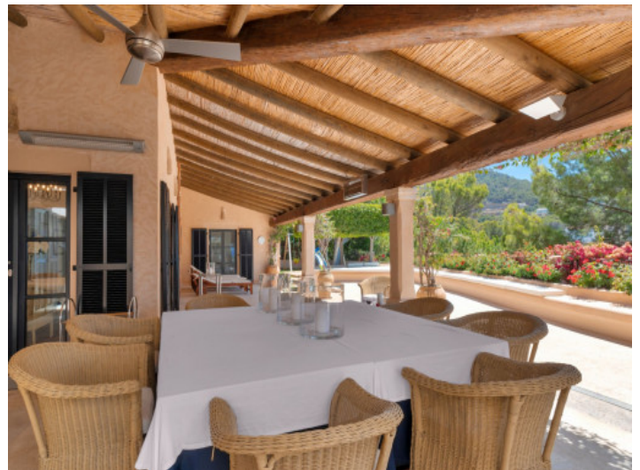
Essbereich auf der Terrasse