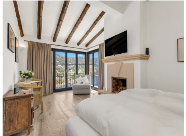
Ein weiteres Schlafzimmer