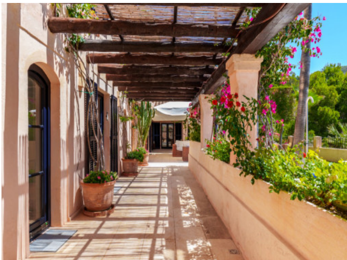
Sehr gepflegter Aussenbereich