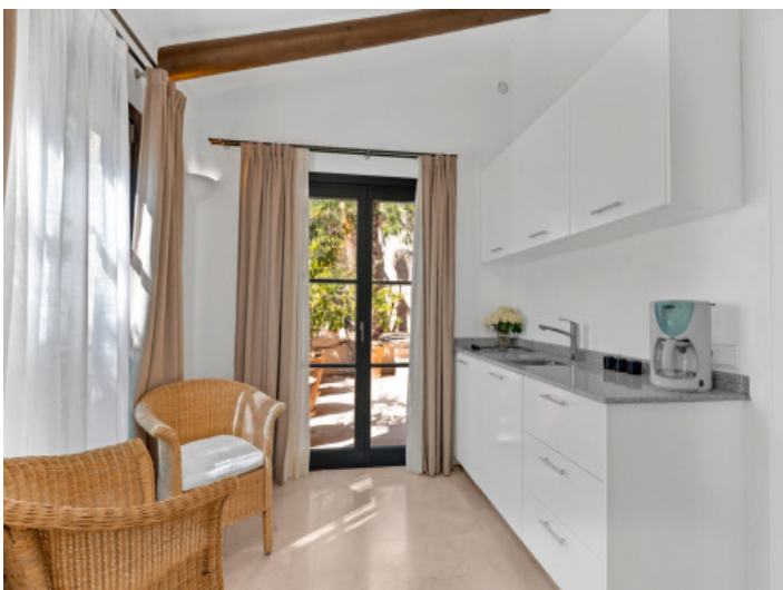
Küche im Gästeappartement