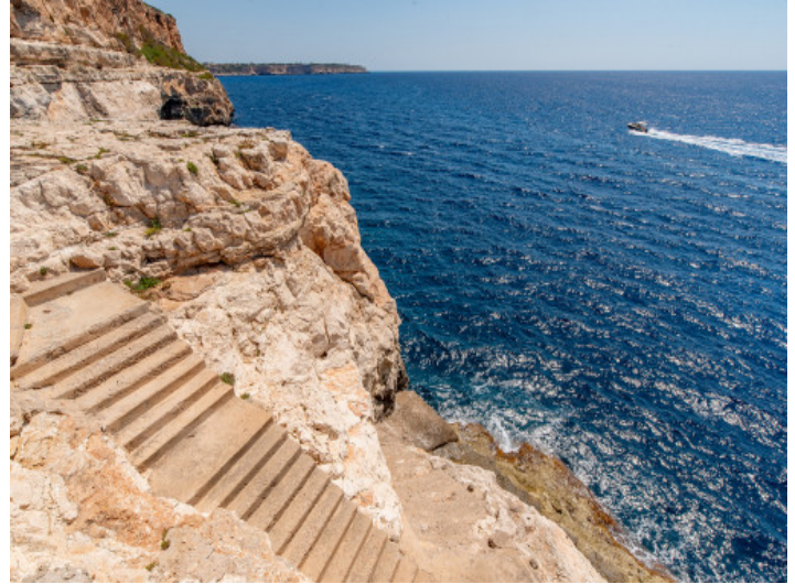
Küste Cala Llombards