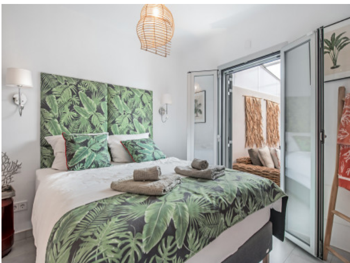
Schlafzimmer Haus 1