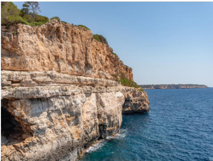
Küste Cala Llombards