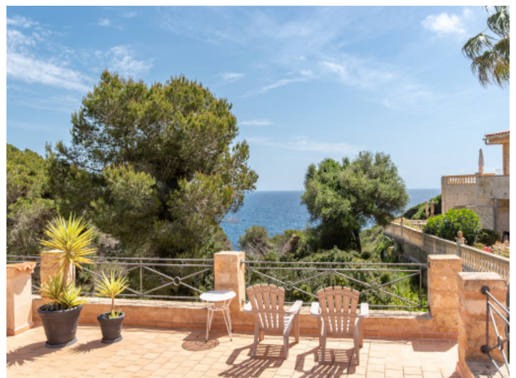
Dachterrasse mit Meerblick

Alle Angaben nach bestem Wissen. Irrtum und Zwischenverkauf vorbehalten. Dieses Exposé ist eine Vorinformation, als Rechtsgrundlage gilt allein der notariell abgeschlossene Kaufvertrag.