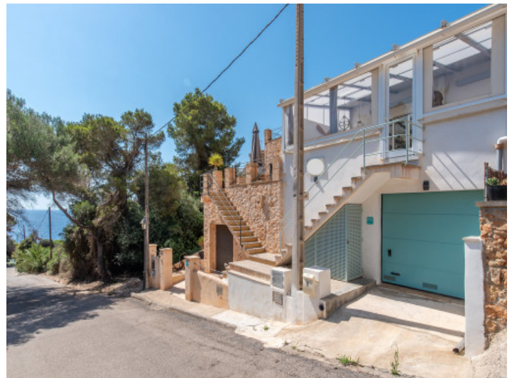
Stylisches Reihenhaus mit Ferienvermietlizenz