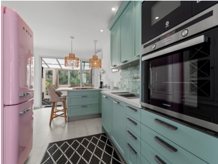
Schicke maßangefertigte Küche