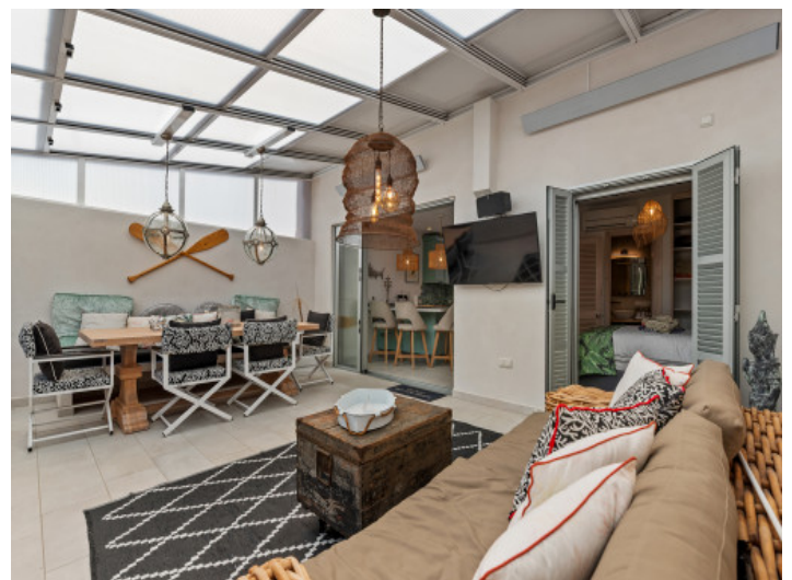
Terrasse mit Dach zum öffnen

Alle Angaben nach bestem Wissen. Irrtum und Zwischenverkauf vorbehalten. Dieses Exposé ist eine Vorinformation, als Rechtsgrundlage gilt allein der notariell abgeschlossene Kaufvertrag.