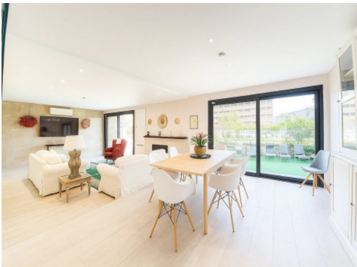
Helles Esszimmer mit offenem Zugang zum Wohnbereich