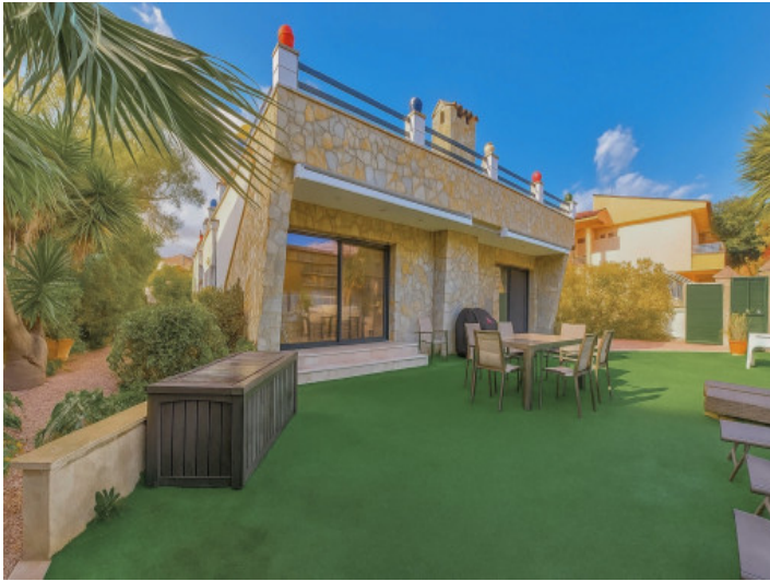
Großzügige Terrassen vor dem Wohnzimmer