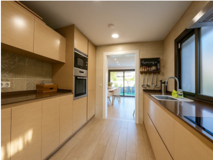
Alternative Ansicht der Einbauküche