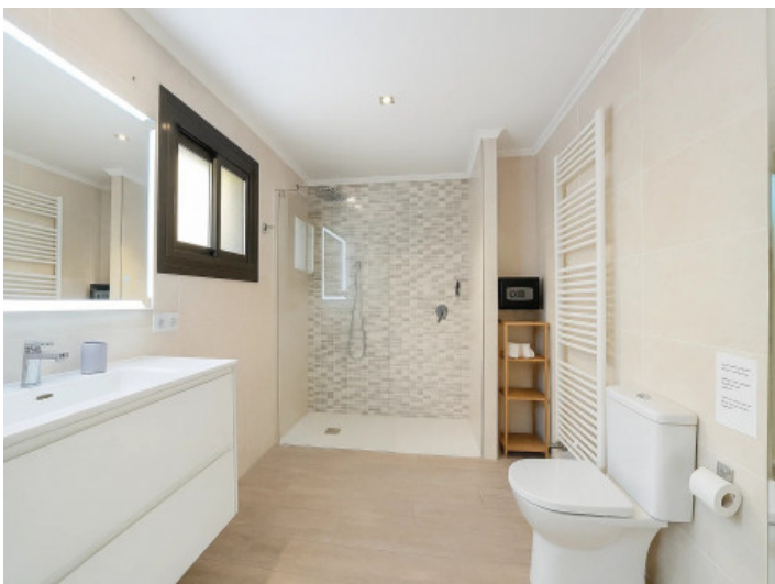
Badezimmer des ersten Doppelschlafzimmers