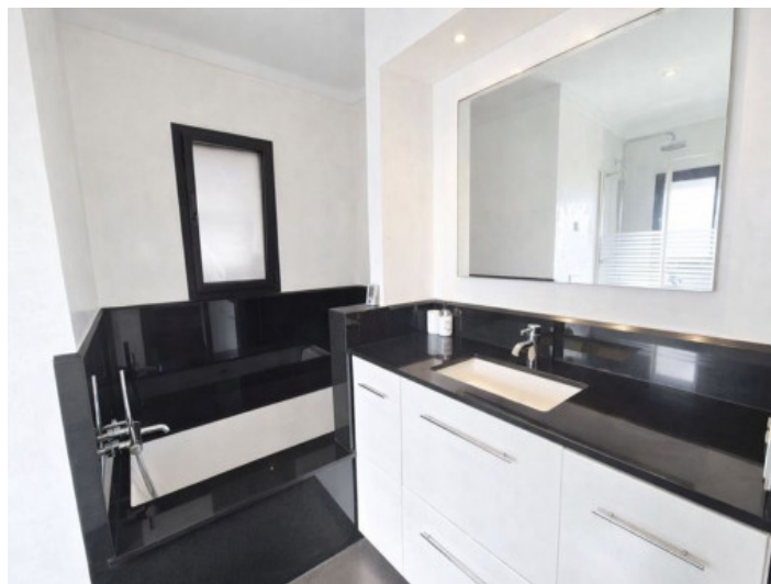
Badezimmer mit Dusche und Badewanne