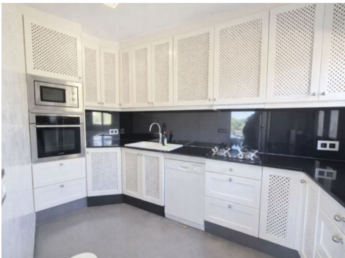
Küche mit allen Elektrogeräten