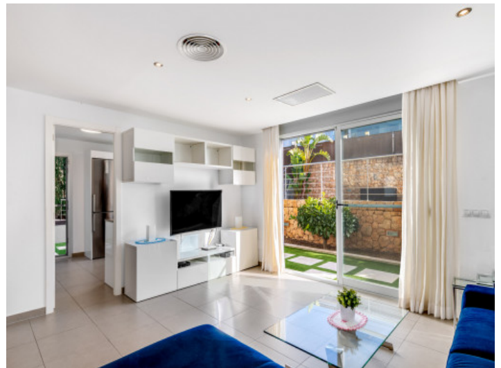
Wohnbereich mit Ausgang zur Terrasse)