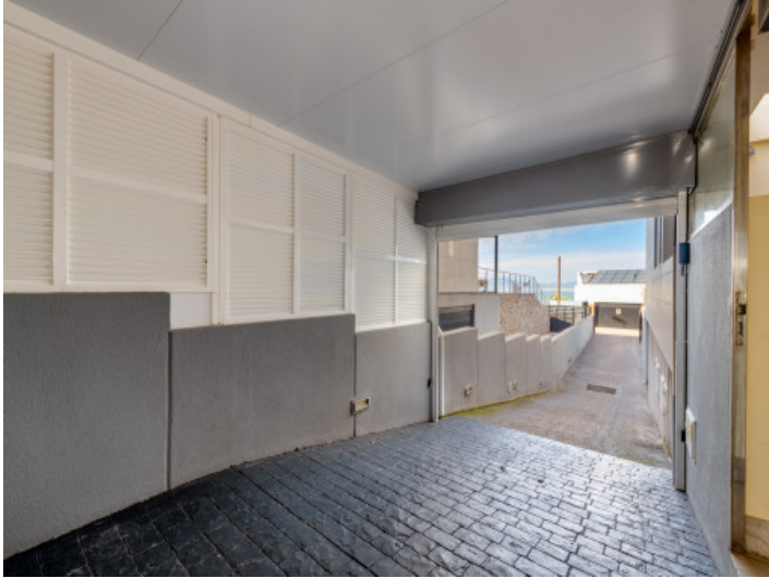
Garage für 2 Autos