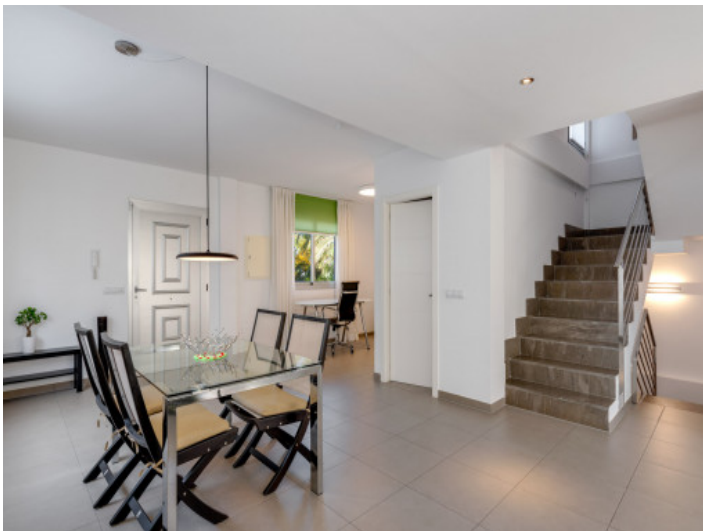
offener Wohn und Essbereich