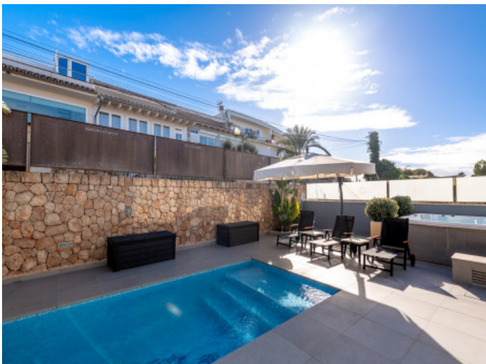
Pool und Jacuzzi