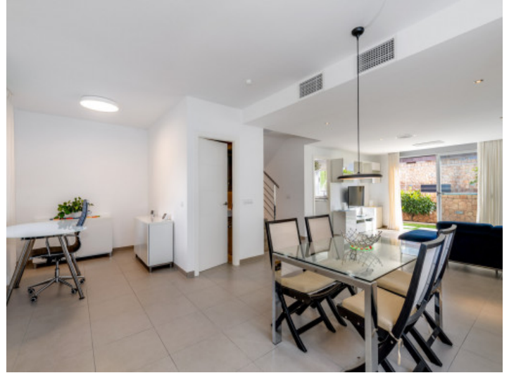
offener Wohn und Essbereich