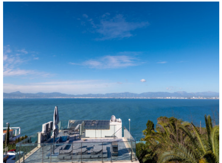
Dachterrasse mit Panoramablick