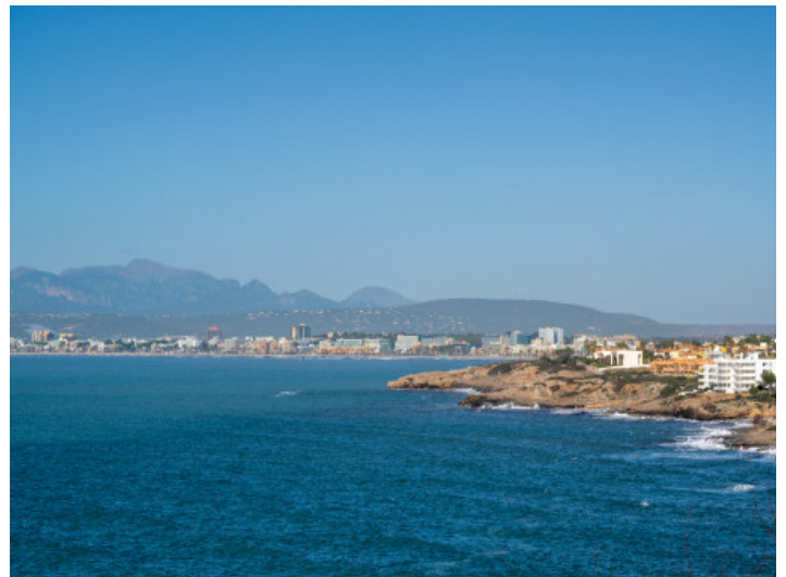
Blick über die Bucht von Palma