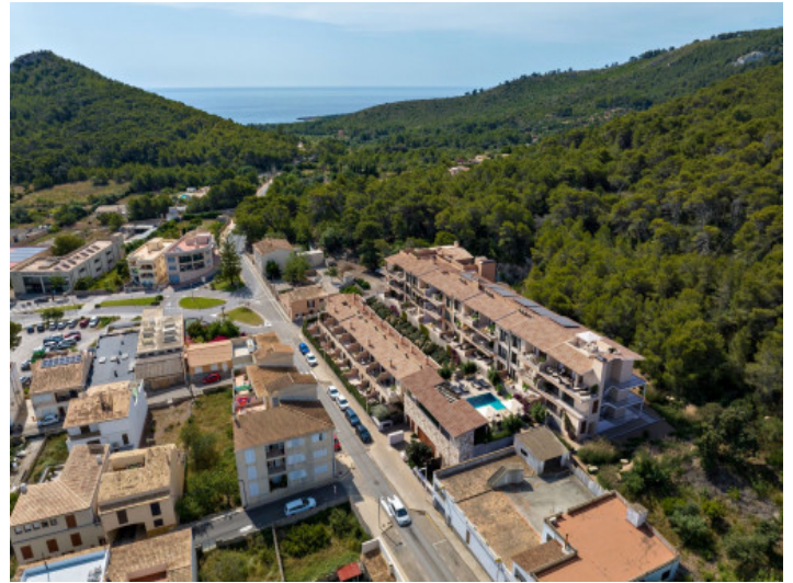
Lage der Residenz

Alle Angaben nach bestem Wissen. Irrtum und Zwischenverkauf vorbehalten. Dieses Exposé ist eine Vorinformation, als Rechtsgrundlage gilt allein der notariell abgeschlossene Kaufvertrag.