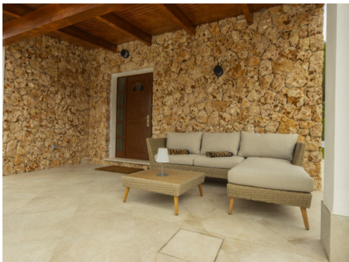
Vordere überdachte Terrasse