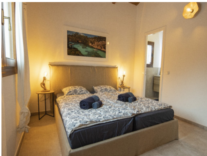
Schlafzimmer mit Bad enSuite