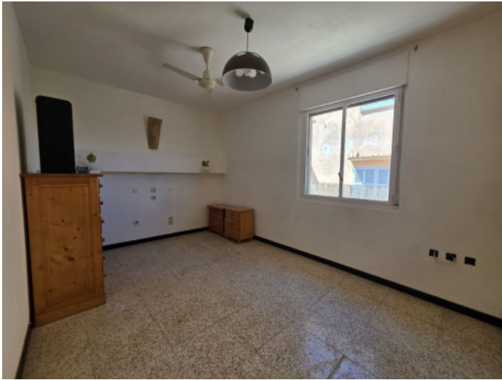
Eins von drei Schlafzimmer