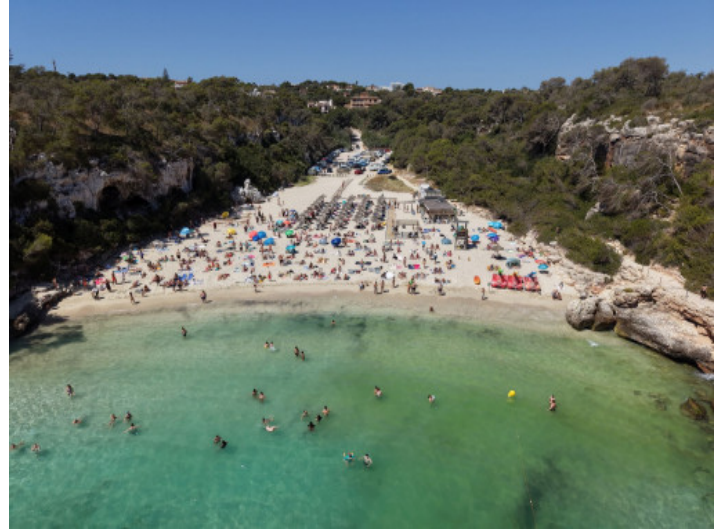
Strand von Cala Llombards