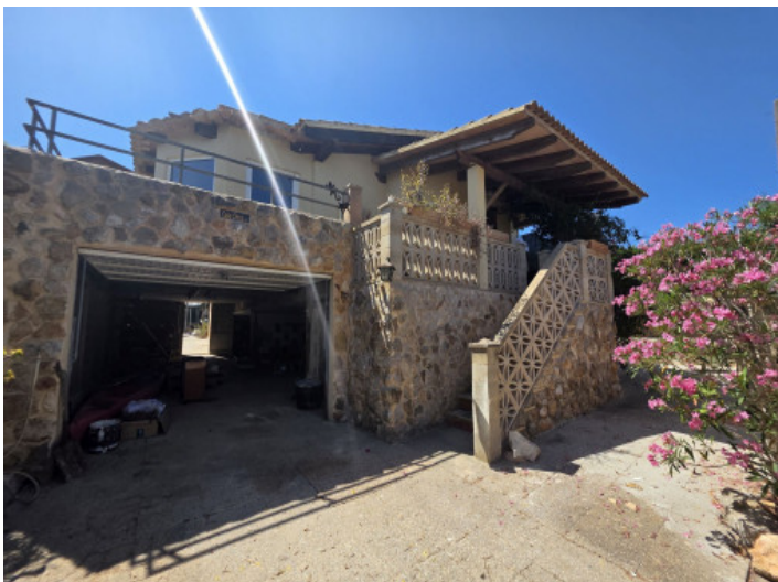
Eingangsbereich mit Garage und Stellplatz