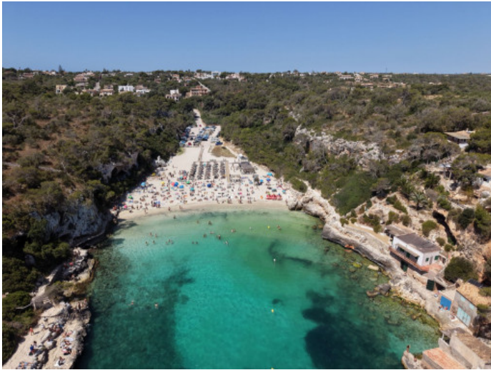
Traumstrand in Cala Llombards