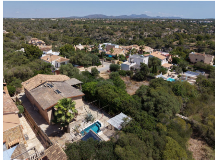
Nur ein paar Meter vom Strand entfernt