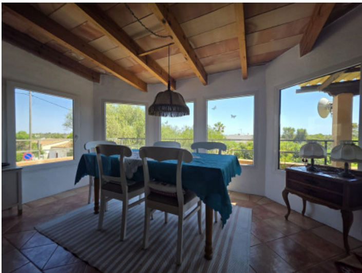
Esszimmer mit Weitblick