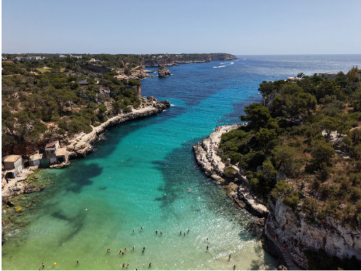
Traumstrand in Cala Llombards