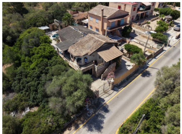
Einfamilienhaus mit Garage und Pool

Alle Angaben nach bestem Wissen. Irrtum und Zwischenverkauf vorbehalten. Dieses Exposé ist eine Vorinformation, als Rechtsgrundlage gilt allein der notariell abgeschlossene Kaufvertrag.