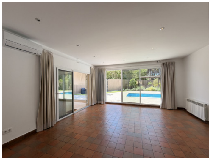
Wohnbereich mit direktem Terrassenzugang