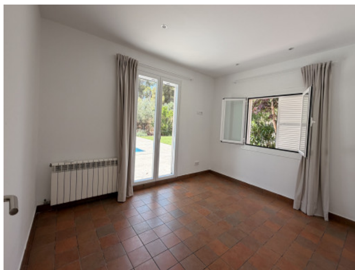
Hauptschlafzimmer mit Zugang auf die Terrasse