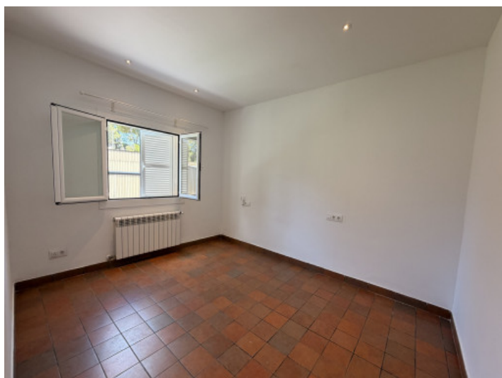
Eines der 3 Schlafzimmer