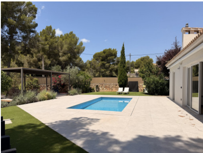
Gepflegter Terrassenbereich mit Pool