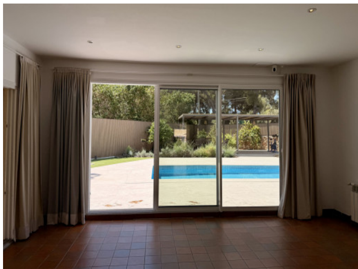
Wohnbereich mit direktem Terrassenzugang