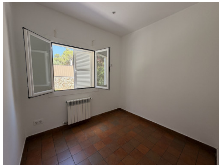
Eines der 3 Schlafzimmer