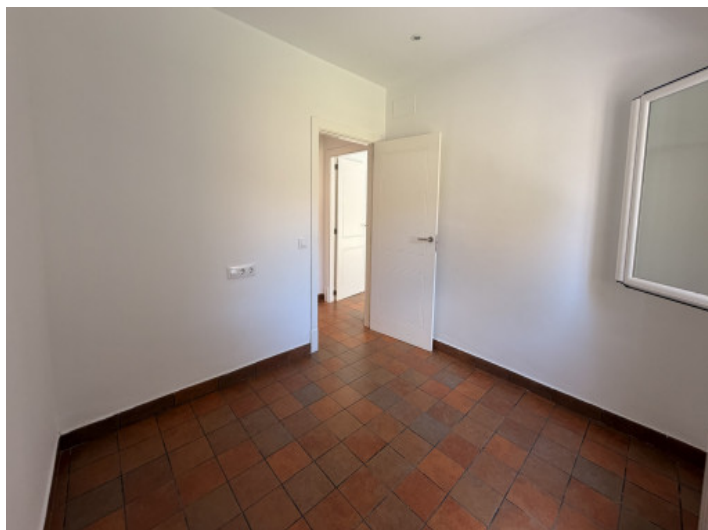
Eines der 3 Schlafzimmer