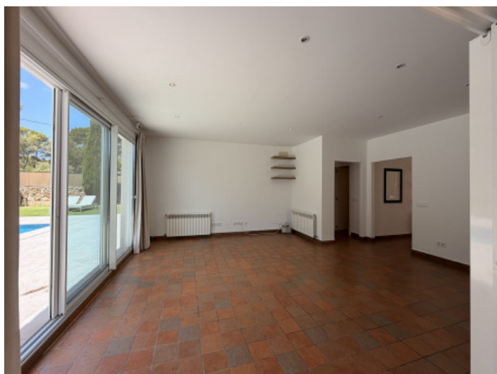
Wohnbereich mit direktem Terrassenzugang