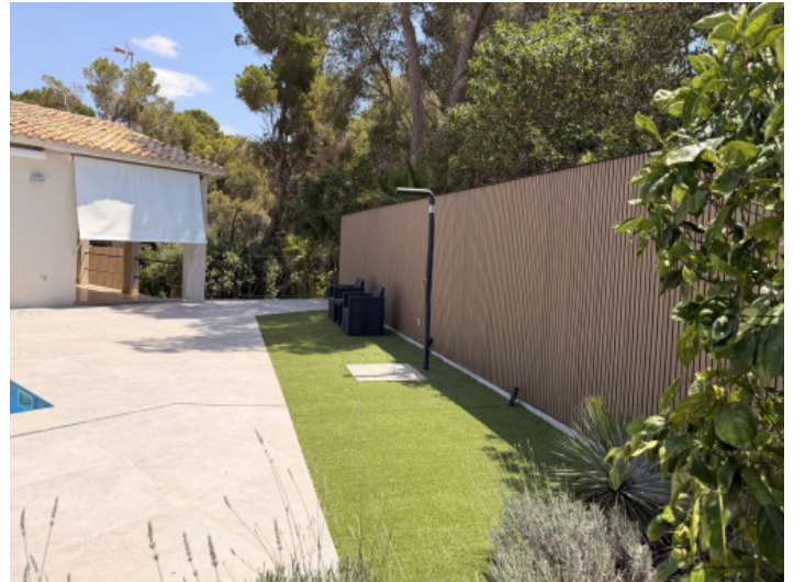
Garten mit Außendusche