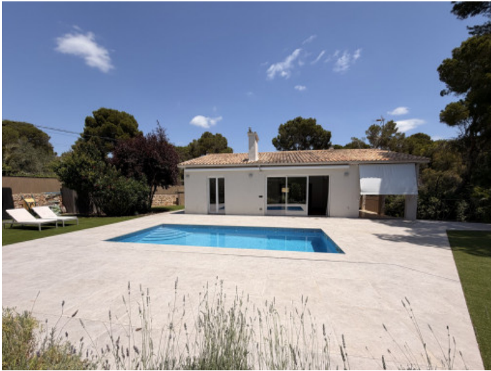
Pool - Terrassenbereich