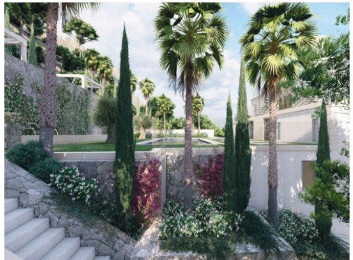
Garten und Poolbereich