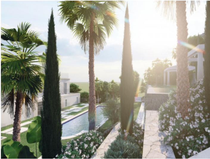
Mediterraner Garten mit Pool