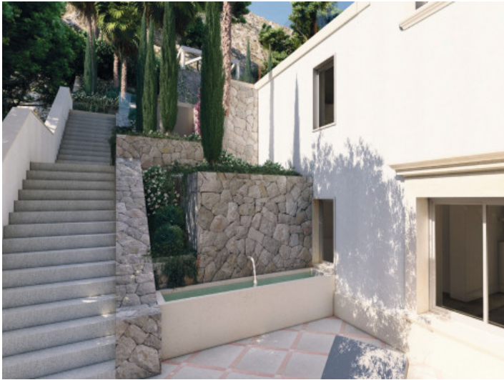
Ansicht des Gartens