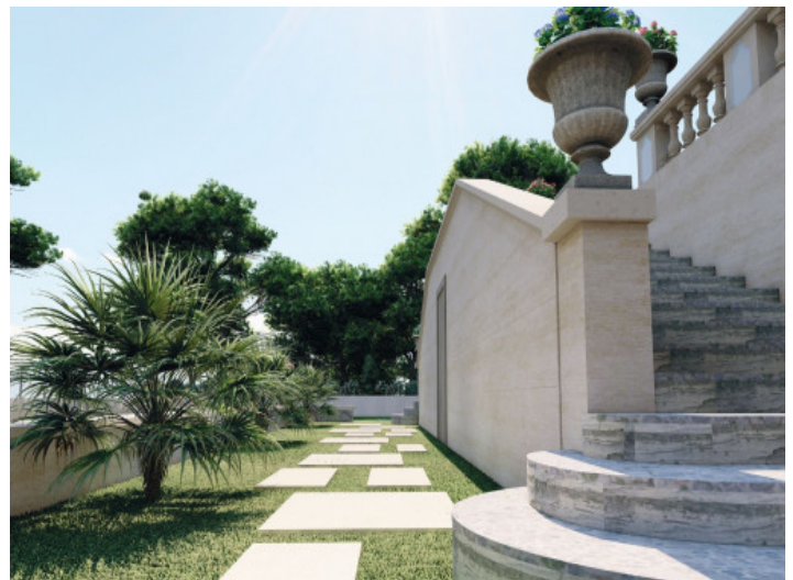
Ansicht des Gartens

Alle Angaben nach bestem Wissen. Irrtum und Zwischenverkauf vorbehalten. Dieses Exposé ist eine Vorinformation, als Rechtsgrundlage gilt allein der notariell abgeschlossene Kaufvertrag.