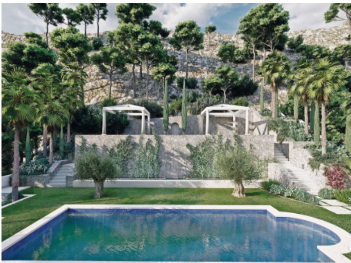
Garten und Poolbereich