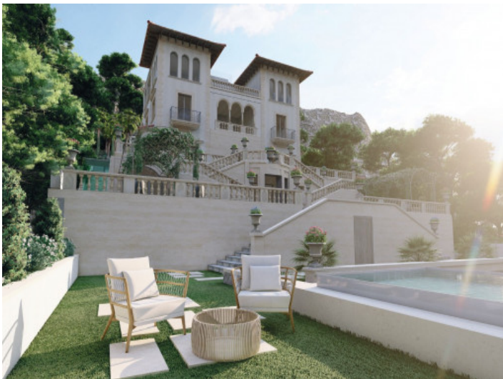
Außenansicht und Poolbereich

Alle Angaben nach bestem Wissen. Irrtum und Zwischenverkauf vorbehalten. Dieses Exposé ist eine Vorinformation, als Rechtsgrundlage gilt allein der notariell abgeschlossene Kaufvertrag.