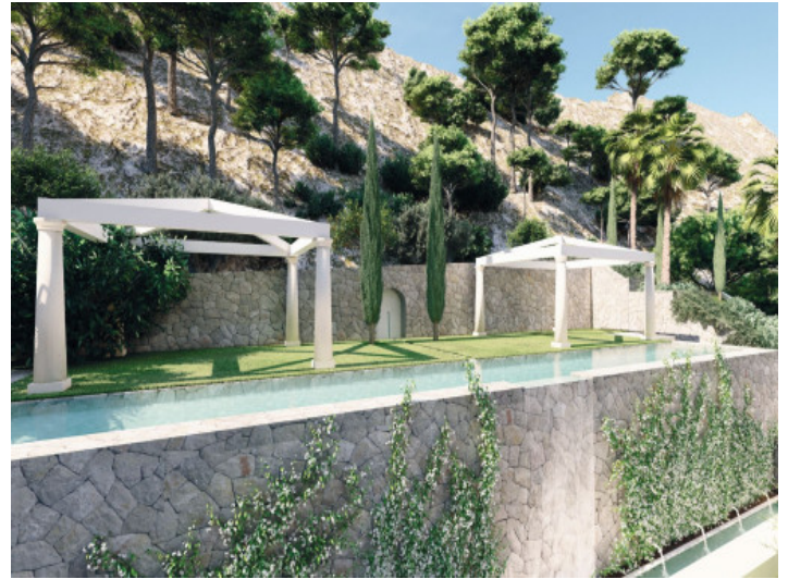
Blick auf den Pool