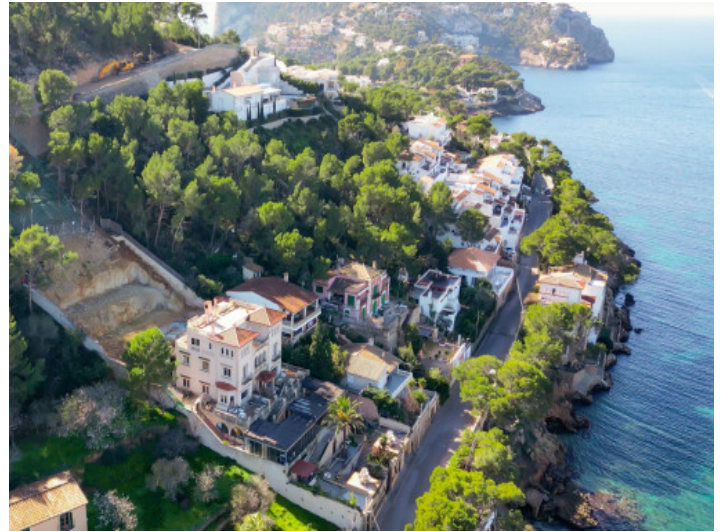
Das Grundstück liegt direkt am Meer