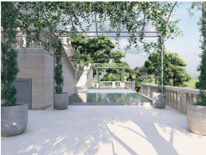
Blick auf den Pool