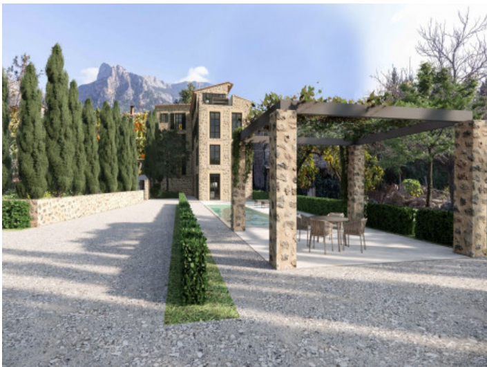
Pool und Außenbereich

Alle Angaben nach bestem Wissen. Irrtum und Zwischenverkauf vorbehalten. Dieses Exposé ist eine Vorinformation, als Rechtsgrundlage gilt allein der notariell abgeschlossene Kaufvertrag.