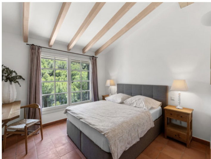
Eines von 6 Schlafzimmern