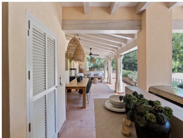
Eine von vielen Terrassen