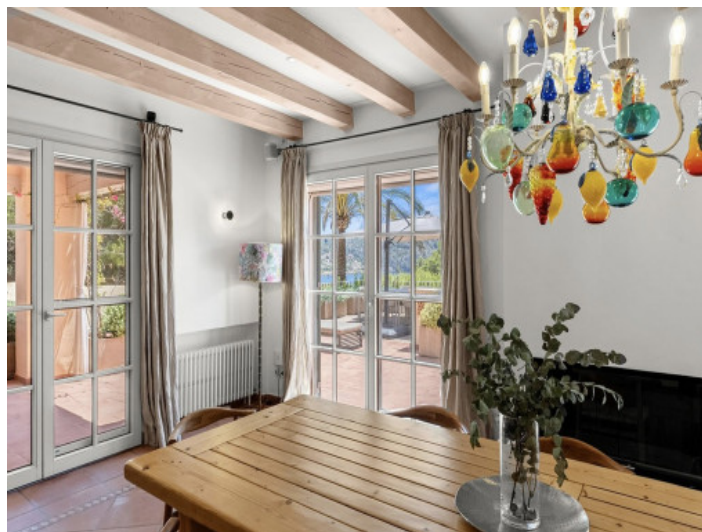
Essbereich mit Blick