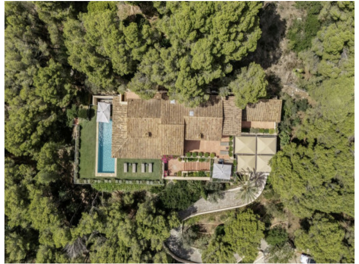
Vogelperspektive der Finca