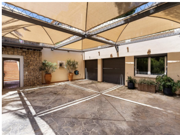
Einfahrt und Garagen

Alle Angaben nach bestem Wissen. Irrtum und Zwischenverkauf vorbehalten. Dieses Exposé ist eine Vorinformation, als Rechtsgrundlage gilt allein der notariell abgeschlossene Kaufvertrag.