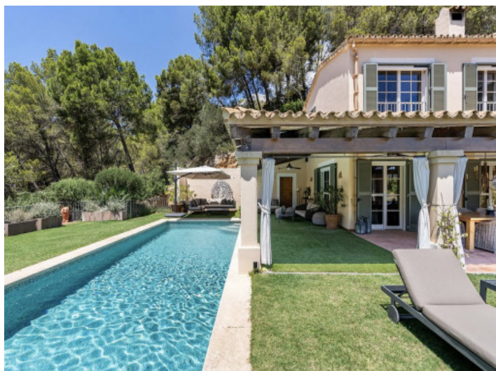
Pool und Gartenbereich