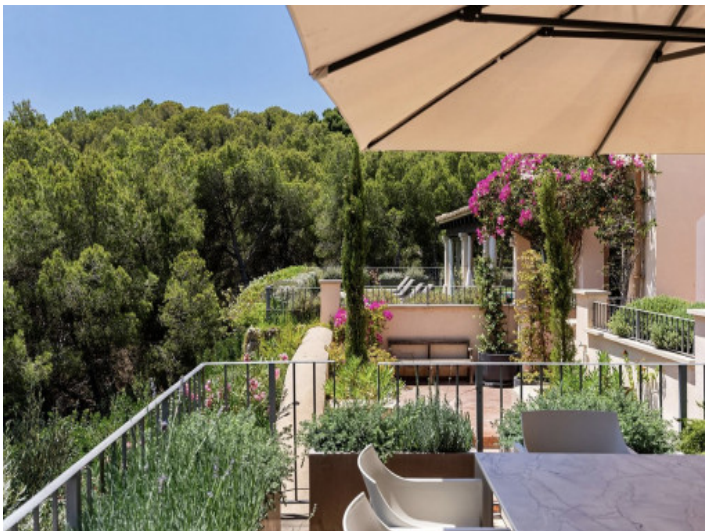
Blick ins Grüne und Privatsphäre