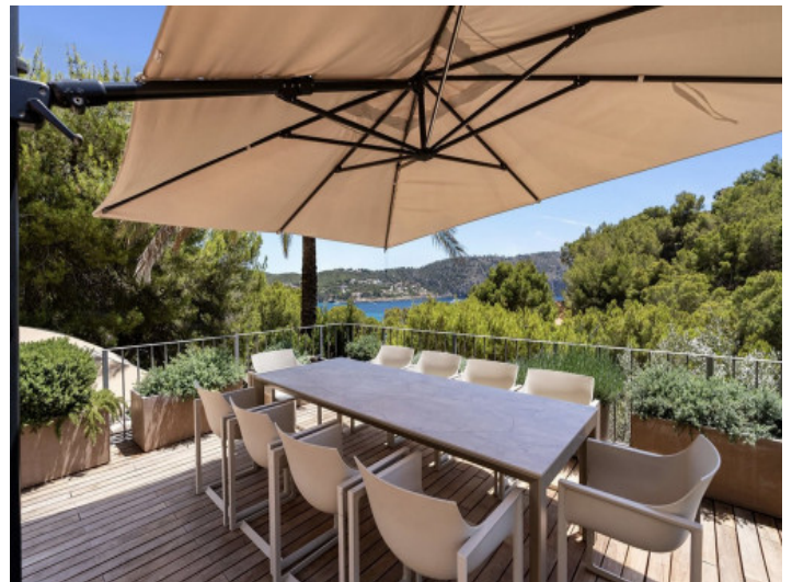
Terrasse mit Meerblick