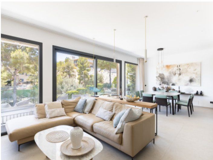
Heller Wohnbereich mit bodentiefen Fenstern