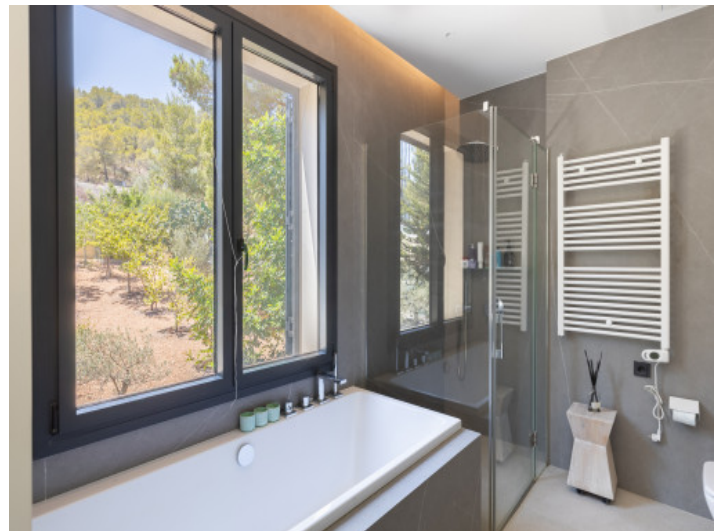
Modernes Badezimmer mit Badewanne