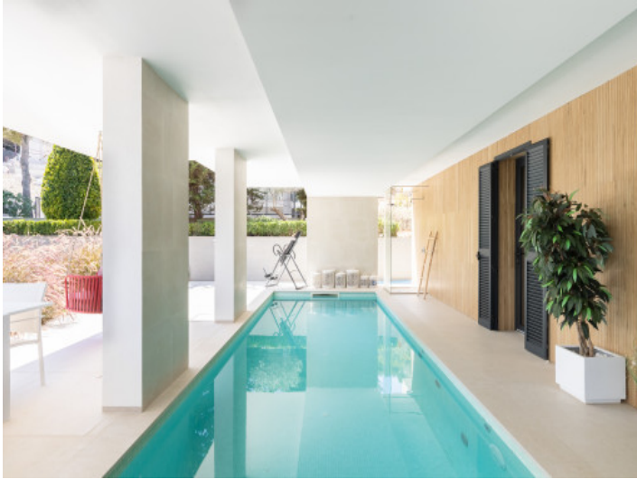
Überdachter Pool Haupthaus