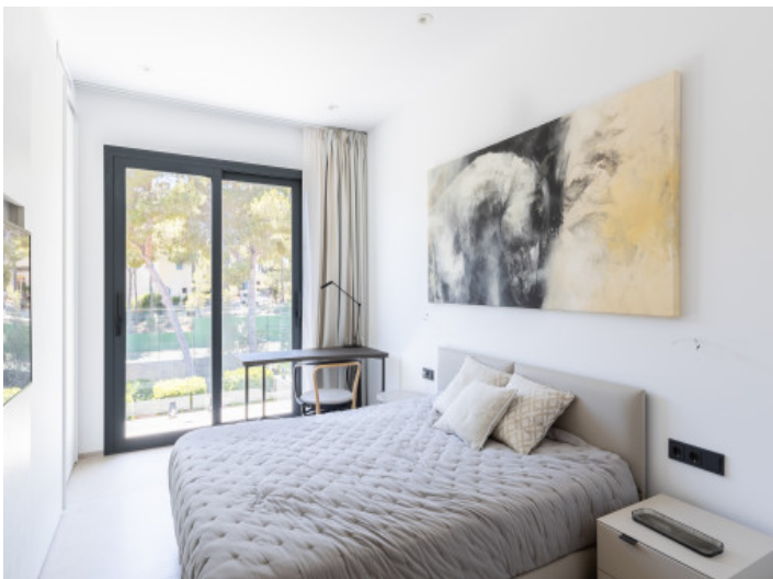
Eines der Schlafzimmer