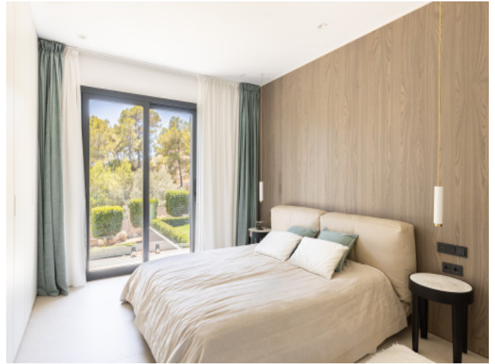
Eines der 5 Schlafzimmer im Haupthaus