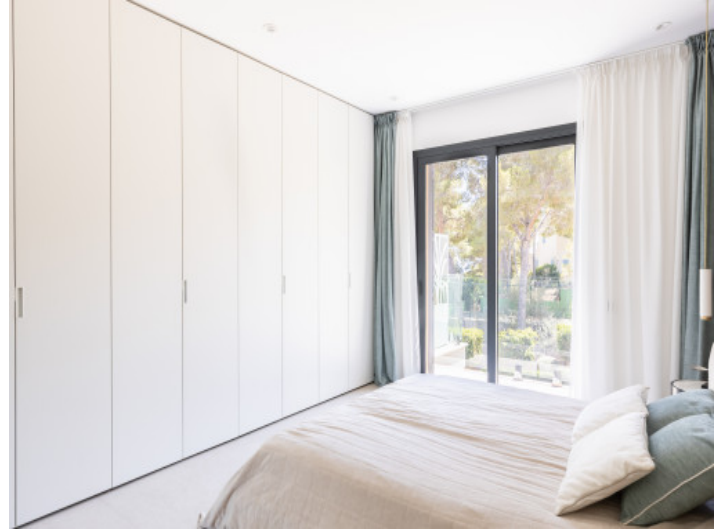
Eines der Schlafzimmer mit Einbauschränken