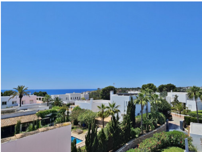
Meerblick von der Dachterrasse