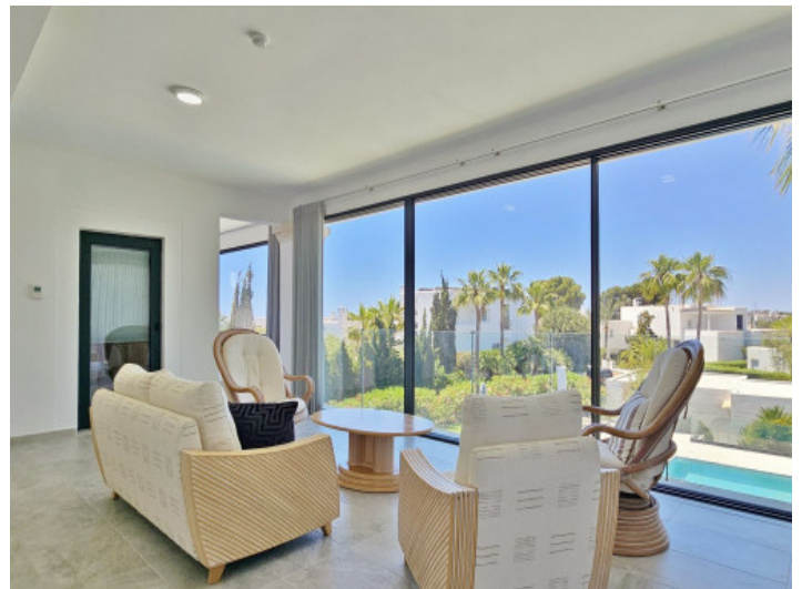
Wohnzimmer im Obergeschoss