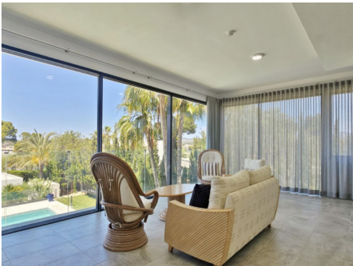
Wohnzimmer im Obergeschoss