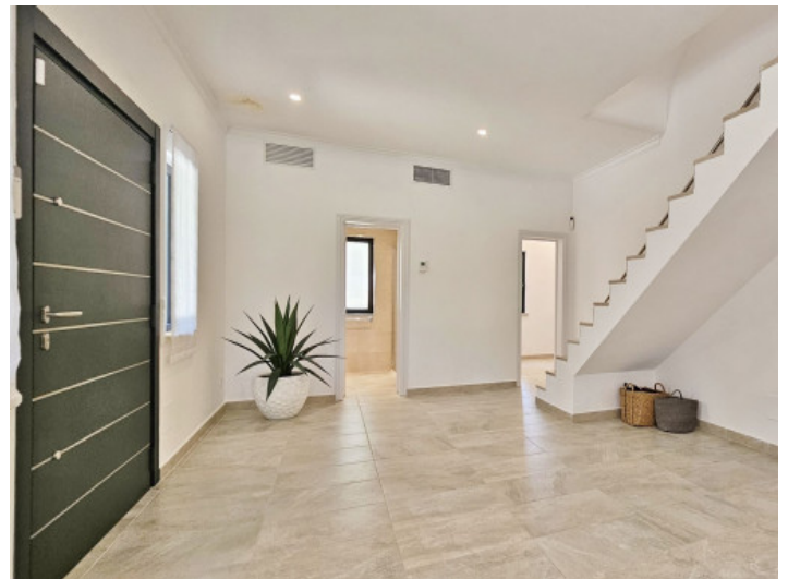
Eingang und Treppenhaus