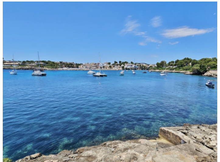
Meer nur wenige Meter entfernt

Alle Angaben nach bestem Wissen. Irrtum und Zwischenverkauf vorbehalten. Dieses Exposé ist eine Vorinformation, als Rechtsgrundlage gilt allein der notariell abgeschlossene Kaufvertrag.