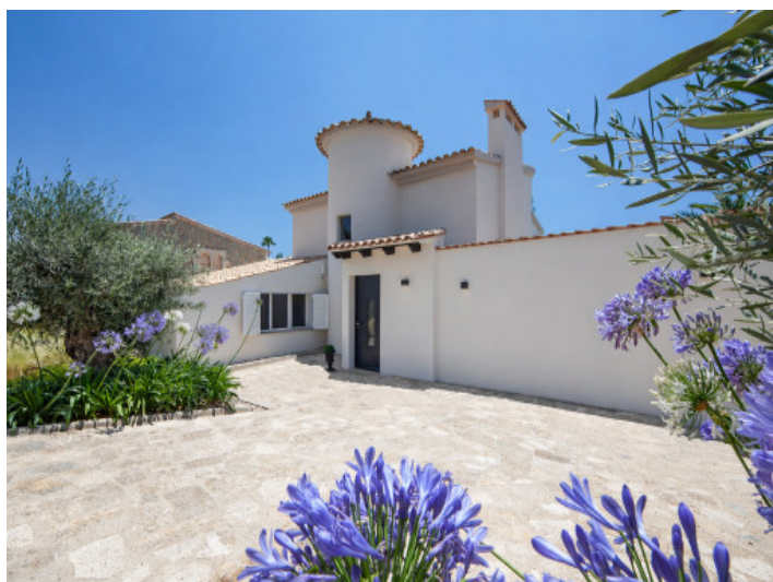
Eingang der Villa