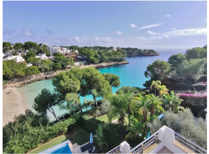
Cala Gran direkt vor der Tür