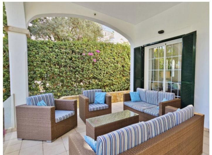
Überdachte Terrasse am Haus

Alle Angaben nach bestem Wissen. Irrtum und Zwischenverkauf vorbehalten. Dieses Exposé ist eine Vorinformation, als Rechtsgrundlage gilt allein der notariell abgeschlossene Kaufvertrag.