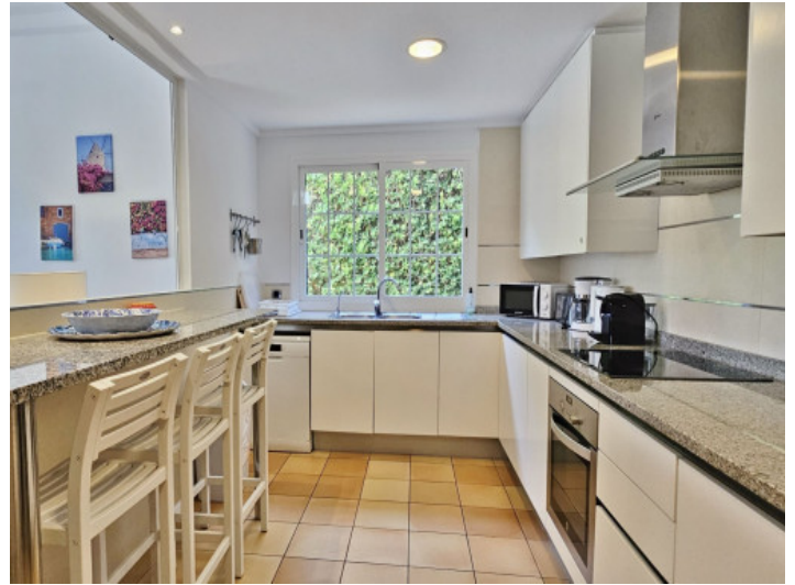
Küche mit Öffnung zum Wohnbereich