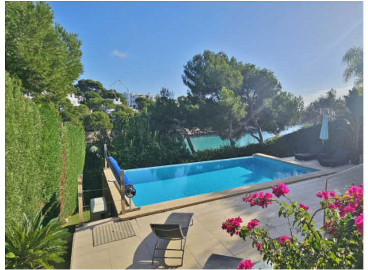
Garten und Pool in erster Meereslinie