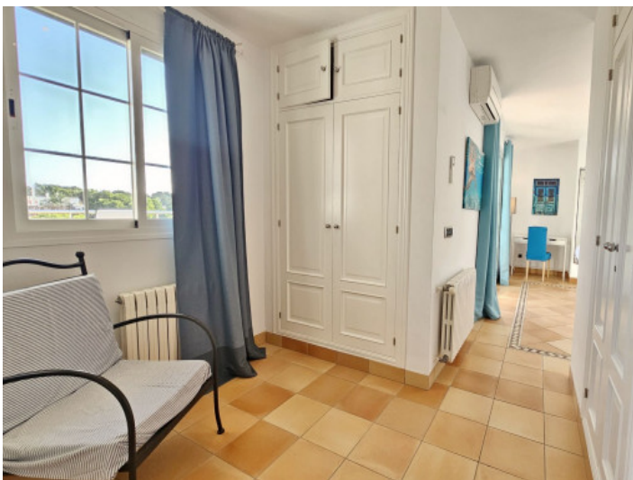
Schlafzimmer in dritter Etage mit Balkon und Bad