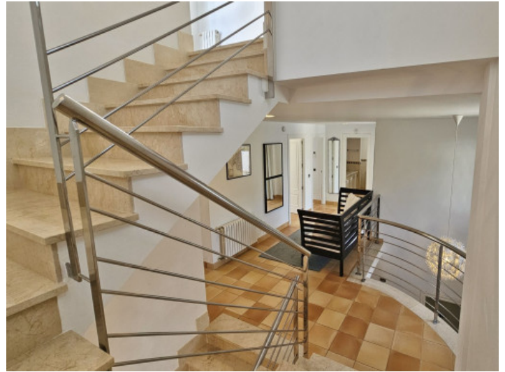
Treppenhaus über drei Etagen