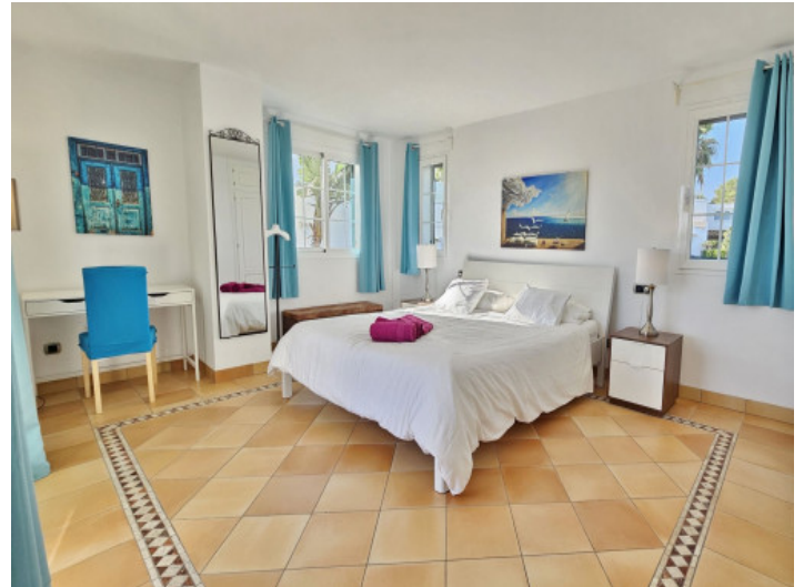
Schlafzimmer in dritter Etage mit Balkon und Bad