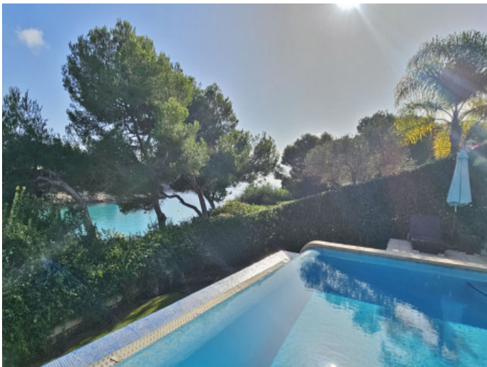
Garten und Pool in erster Meereslinie