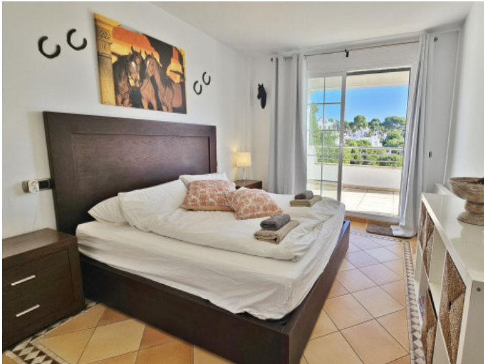
Schlafzimmer alle mit Ausgang zum Balkon