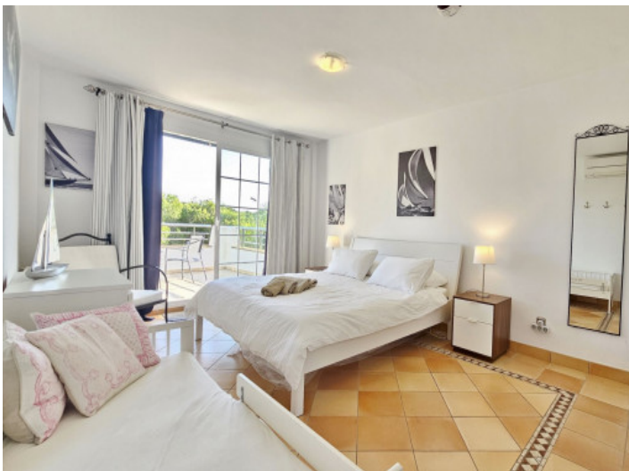
Schlafzimmer alle mit Ausgang zum Balkon