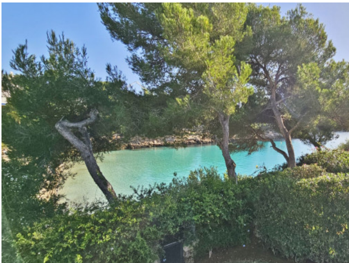
Cala Gran direkt vor der Tür