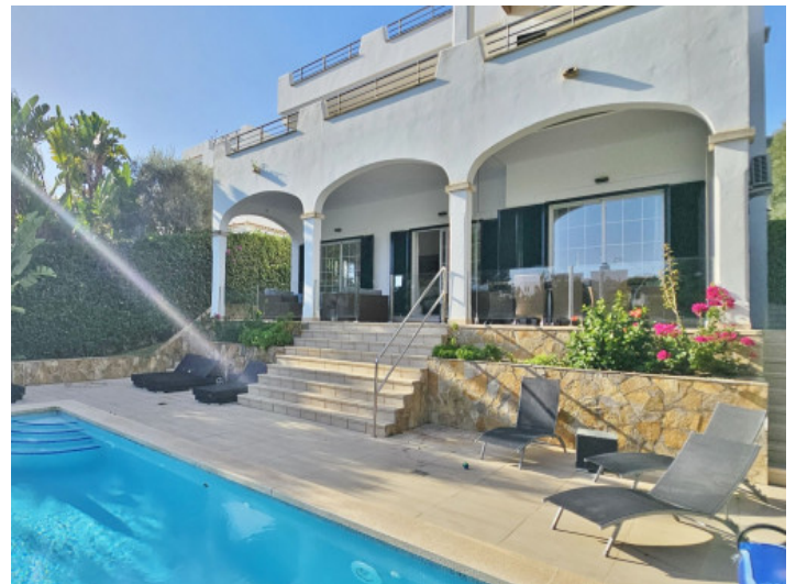
Überdachte Terrasse und Sonnenterrasse