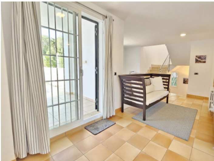
Treppenhaus über drei Etagen