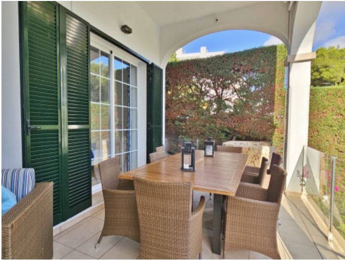
Überdachte Terrasse am Haus