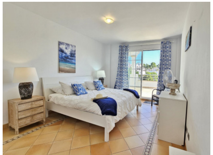
Schlafzimmer alle mit Ausgang zum Balkon

Alle Angaben nach bestem Wissen. Irrtum und Zwischenverkauf vorbehalten. Dieses Exposé ist eine Vorinformation, als Rechtsgrundlage gilt allein der notariell abgeschlossene Kaufvertrag.