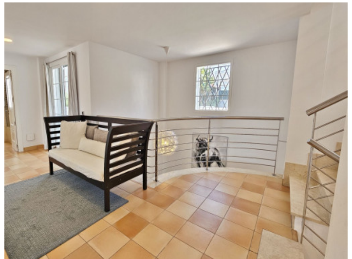
Treppenhaus über drei Etagen