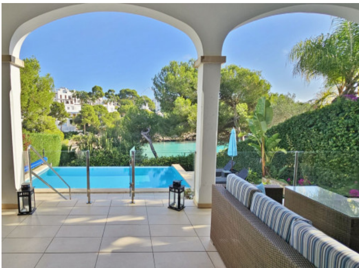
Meerblick von der Terrasse aus