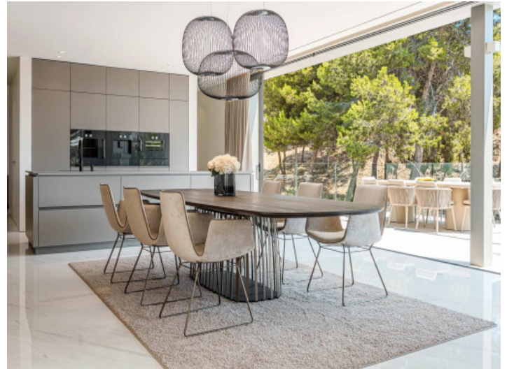
Lichtdurchfluteter Essbereich mit Zugang auf die Terrasse