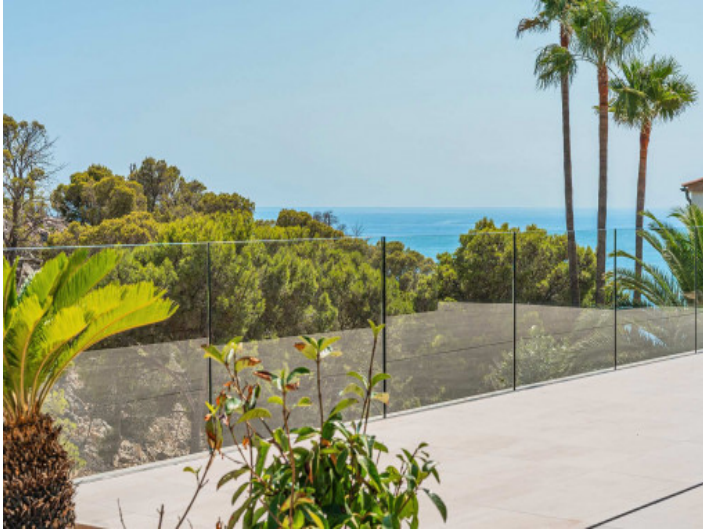
Idyllische Atmosphäre mit seitlichem Meerblick