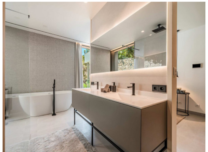
Eines der 5 Badezimmer

Alle Angaben nach bestem Wissen. Irrtum und Zwischenverkauf vorbehalten. Dieses Exposé ist eine Vorinformation, als Rechtsgrundlage gilt allein der notariell abgeschlossene Kaufvertrag.