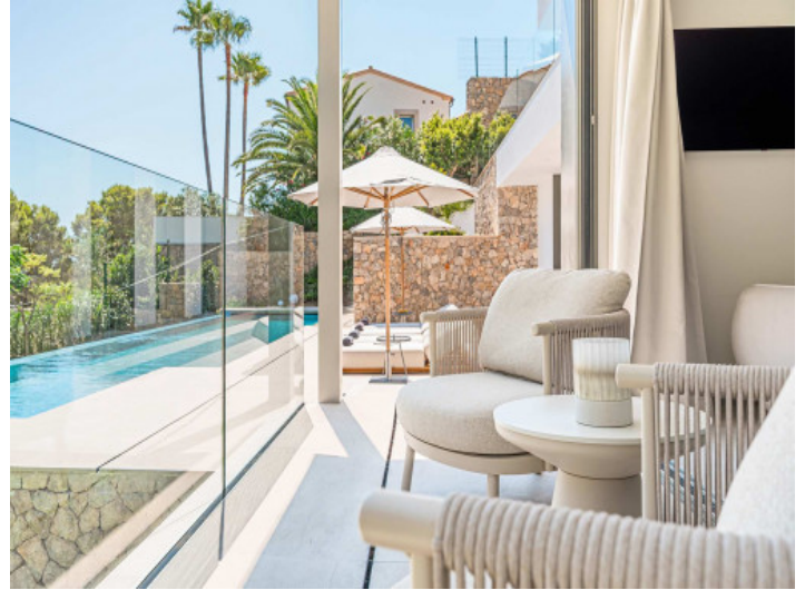
Zeit zum Genießen