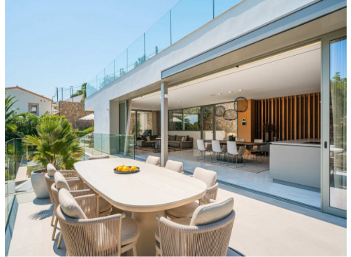
Offener Wohn-Essbereich mit direktem Zugang zur großzügigen Terrasse