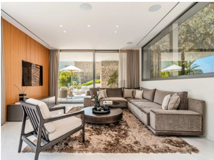
Moderner Wohnbereich mit großer Fensterfront