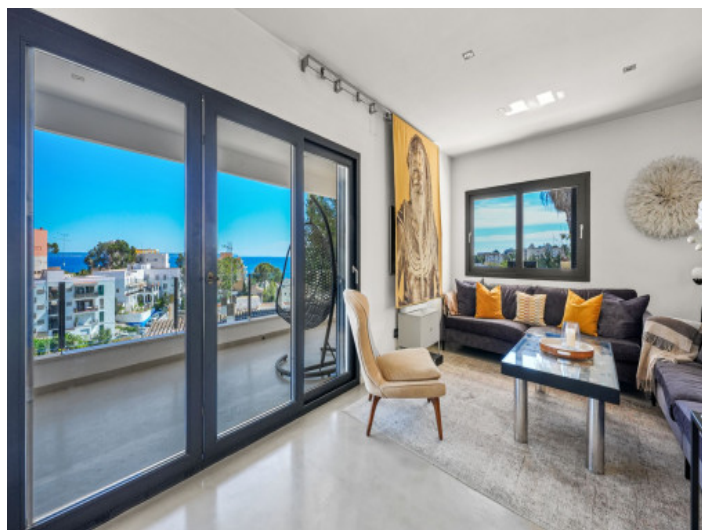
Wohnbereich mit Meerblick und Balkonzugang

Alle Angaben nach bestem Wissen. Irrtum und Zwischenverkauf vorbehalten. Dieses Exposé ist eine Vorinformation, als Rechtsgrundlage gilt allein der notariell abgeschlossene Kaufvertrag.