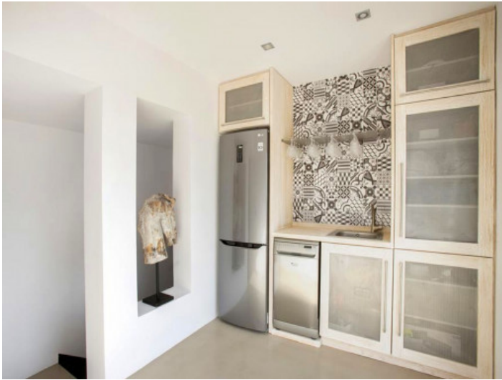
Küchenzeile im Gästearpartment