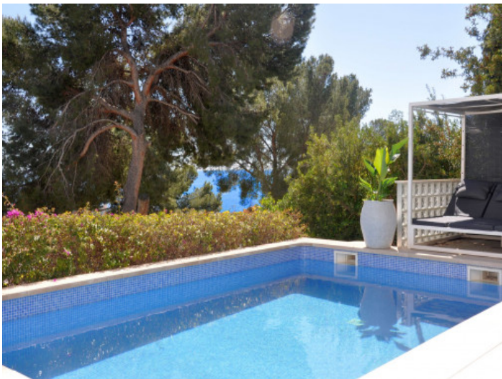
Privater Pool mit Sonnenterrasse

Alle Angaben nach bestem Wissen. Irrtum und Zwischenverkauf vorbehalten. Dieses Exposé ist eine Vorinformation, als Rechtsgrundlage gilt allein der notariell abgeschlossene Kaufvertrag.