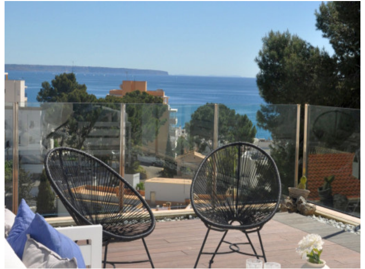
Dachterrasse mit Meerblick