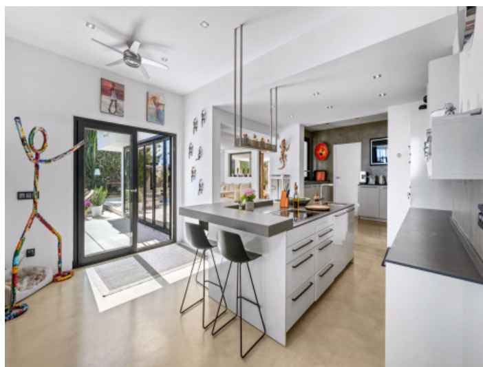
oderne Küche mit offenem Wohnkonzept