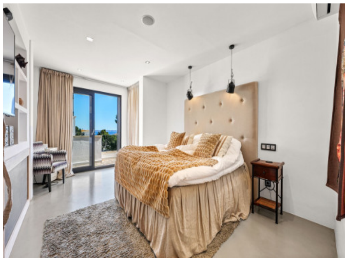
Schlafzimmer mit ruhiger Atmosphäre