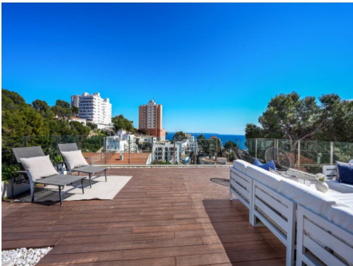
Großzügige Dachterrasse mit Meerblick