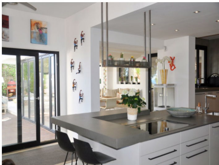
Designküche mit zentraler Kochinsel