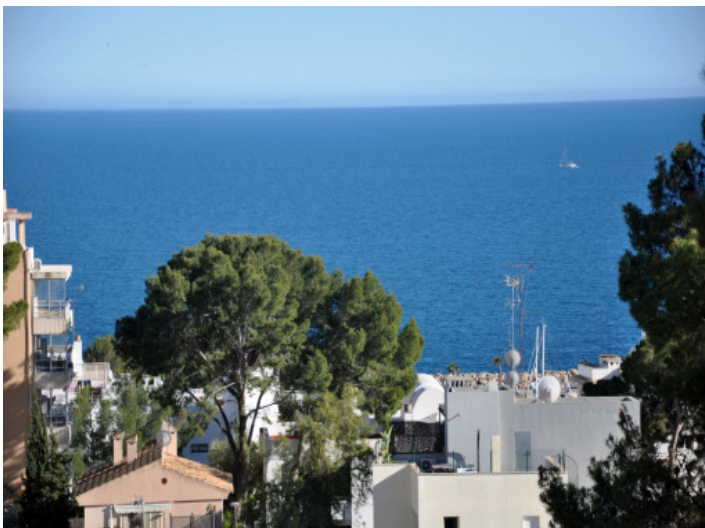
Weitblick über die Küste von San Agustín