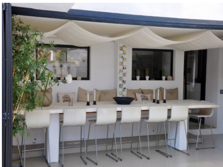
Mediterraner Außenbereich mit Sitzplatz