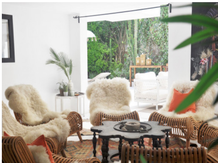
Gemütlicher Wohnbereich mit moderner Ausstattung