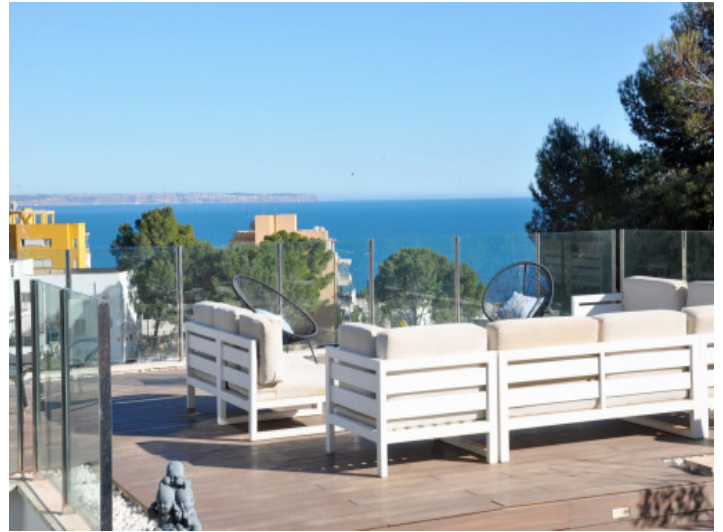
Meerblick und moderne Architektur