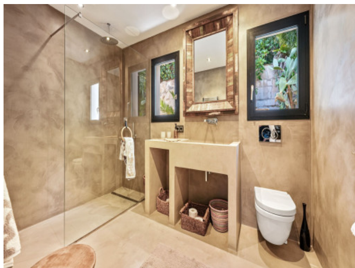
Badezimmer mit Natursteinoptik

Alle Angaben nach bestem Wissen. Irrtum und Zwischenverkauf vorbehalten. Dieses Exposé ist eine Vorinformation, als Rechtsgrundlage gilt allein der notariell abgeschlossene Kaufvertrag.