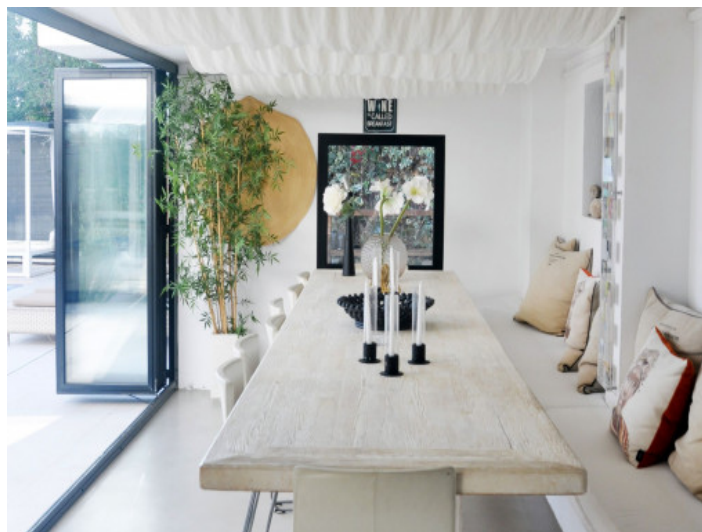
Heller Essbereich mit Terrassenzugang