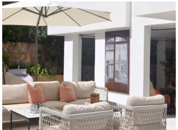
Lounge im Außenbereich

Alle Angaben nach bestem Wissen. Irrtum und Zwischenverkauf vorbehalten. Dieses Exposé ist eine Vorinformation, als Rechtsgrundlage gilt allein der notariell abgeschlossene Kaufvertrag.