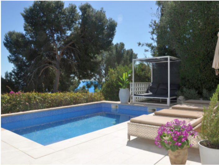
Privater Pool mit Sonnenterrasse