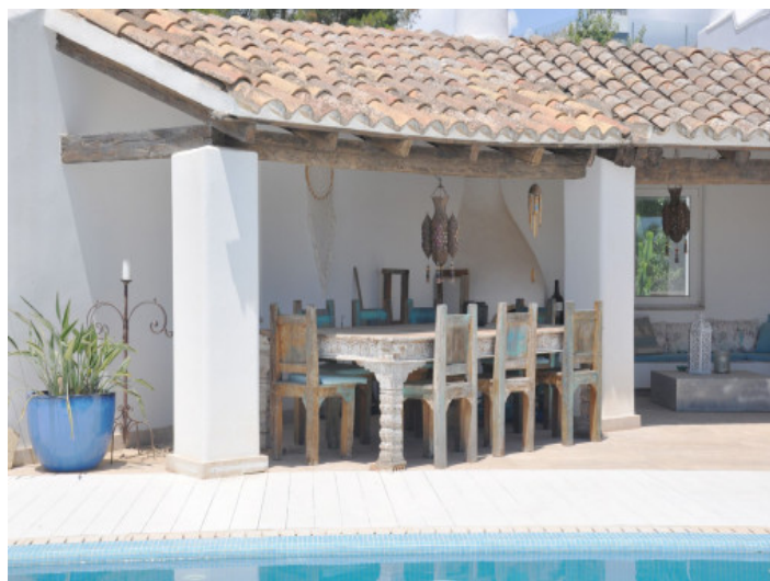
Überdachter BBQ- und Essbereich im Freien

Alle Angaben nach bestem Wissen. Irrtum und Zwischenverkauf vorbehalten. Dieses Exposé ist eine Vorinformation, als Rechtsgrundlage gilt allein der notariell abgeschlossene Kaufvertrag.