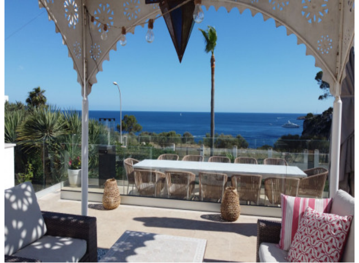
Dachterrasse mit Meerblick und Loungebereich