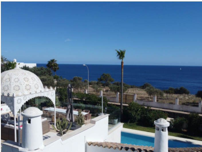
Großzügige Terrasse mit Meerblick