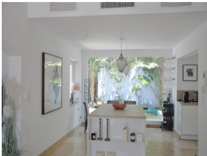
Offene Küche und Essbereich mit viel Tageslicht