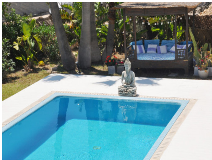
Poolbereich mit mediterraner Architektur