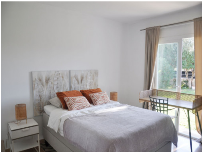
Helles Schlafzimmer mit Blick ins Grüne