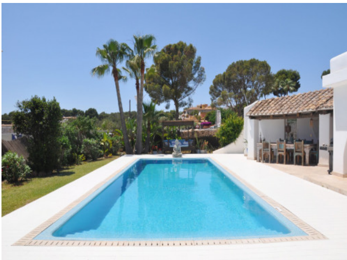
14-Meter-Salzwasserpool mit Sonnenterrasse