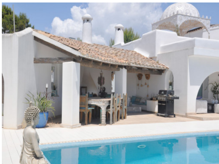
Überdachter BBQ- und Essbereich im Freien