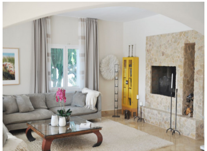
Heller Wohnbereich mit mediterraniem Charakter

Alle Angaben nach bestem Wissen. Irrtum und Zwischenverkauf vorbehalten. Dieses Exposé ist eine Vorinformation, als Rechtsgrundlage gilt allein der notariell abgeschlossene Kaufvertrag.