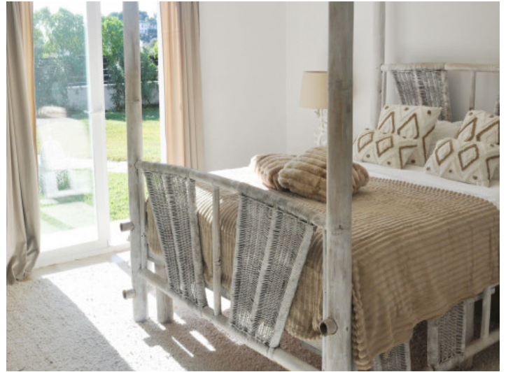
Schlafzimmer mit direktem Terrassenzugang