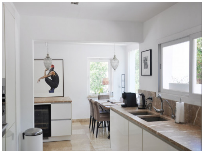
Moderne und voll ausgestattete Küche