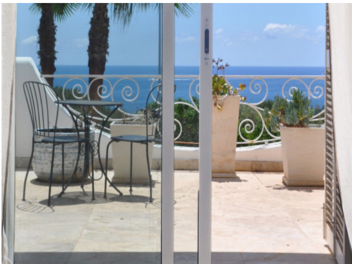
Terrasse mit Meerblick und Außenlounge