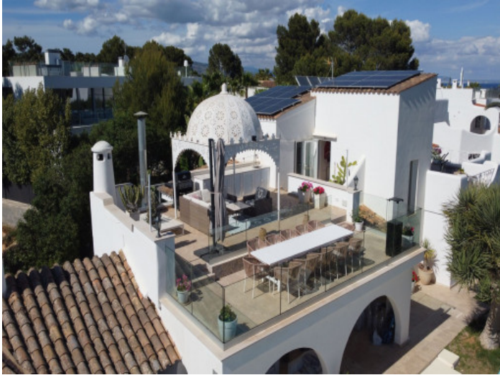
Villa mit Meerblick und mediterraner Architektur