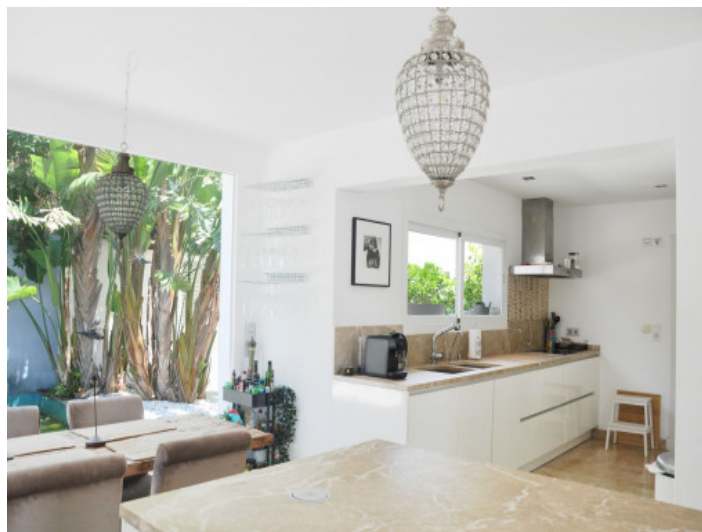
Offene Küche und Essbereich mit viel Tageslicht