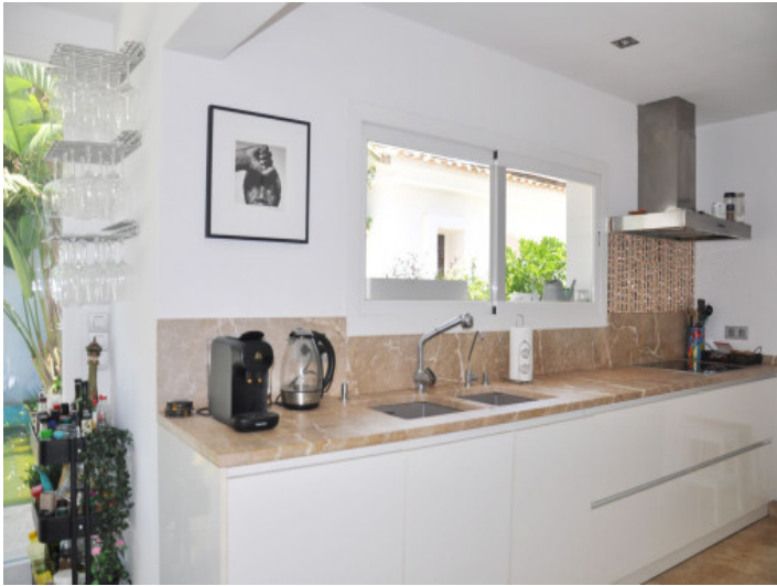
Moderne Küche mit offenem Wohnkonzept