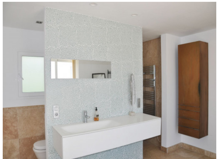
Modernes Badezimmer mit Dusche

Alle Angaben nach bestem Wissen. Irrtum und Zwischenverkauf vorbehalten. Dieses Exposé ist eine Vorinformation, als Rechtsgrundlage gilt allein der notariell abgeschlossene Kaufvertrag.