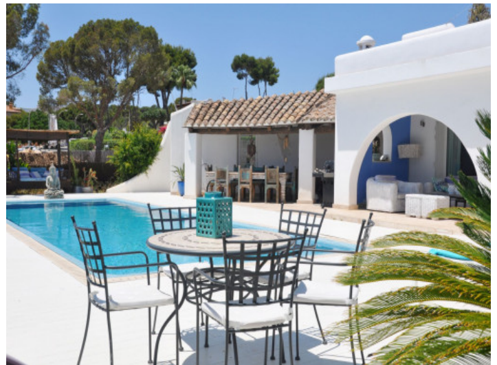
Außenbereich mit Pool und verschiedenen Ruheplätzen