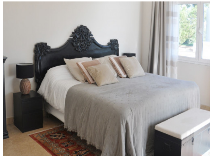
Gemütliches Schlafzimmer mit ruhiger Atmosphäre