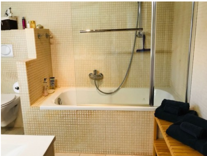
Eines von 2 Badezimmern