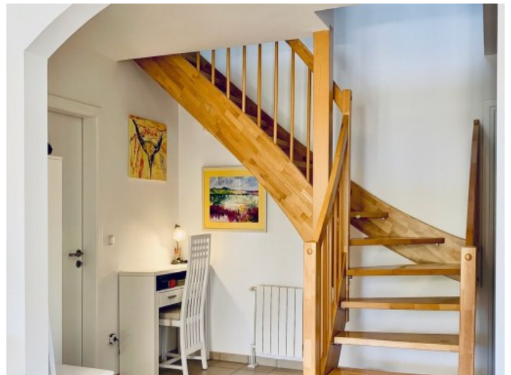
Zugang zum Obergeschoss