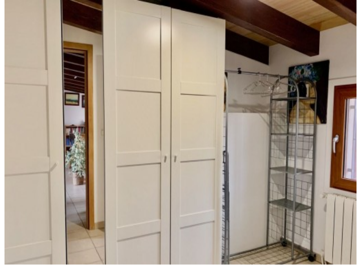
Eines von 3 Schlafzimmern