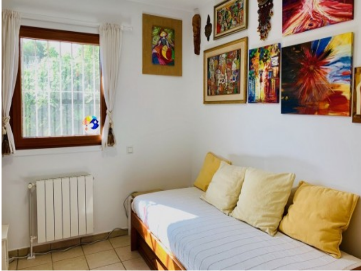
Eines von 3 Schlafzimmern