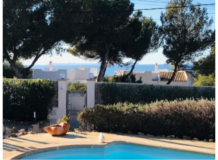
Pool und Meerblick