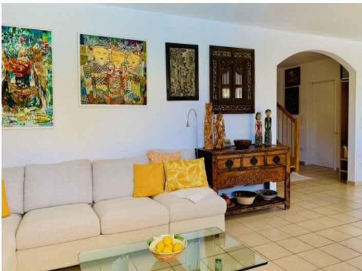
Großer Wohn- und Essbereich