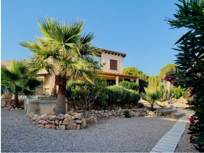
Außenansicht der Finca