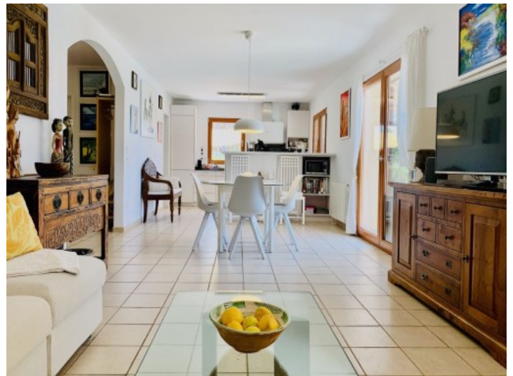
Heller Wohn- und Essbereich