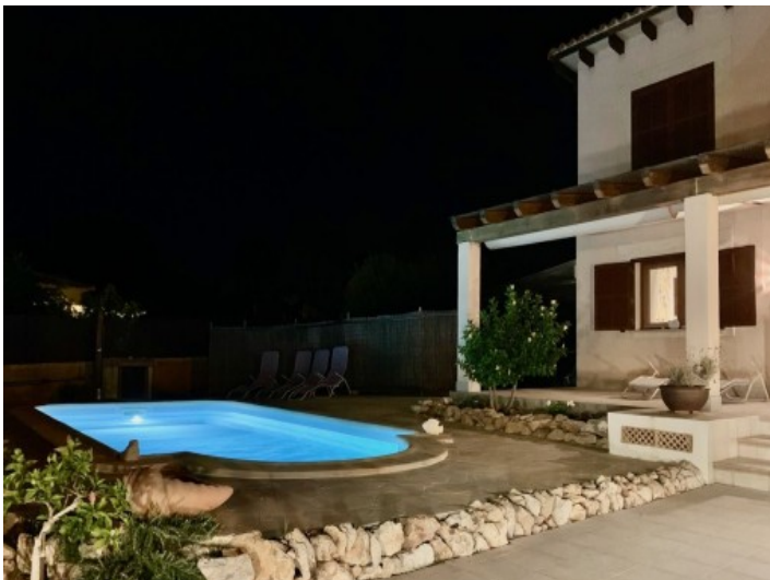
Poolbereich bei Nacht