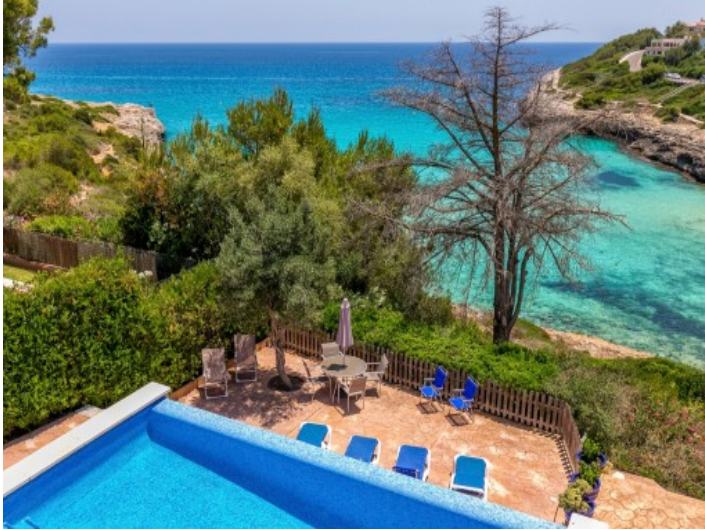
In erster Meereslinie gelegen