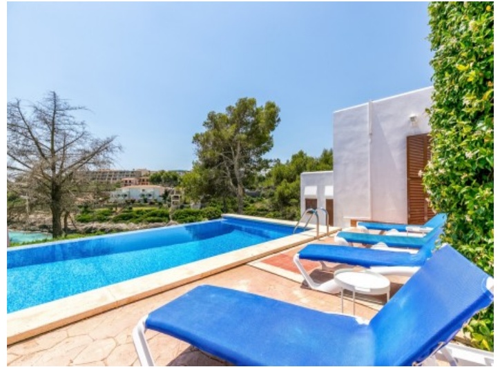
Sonniger Poolbereich mit Meerblick