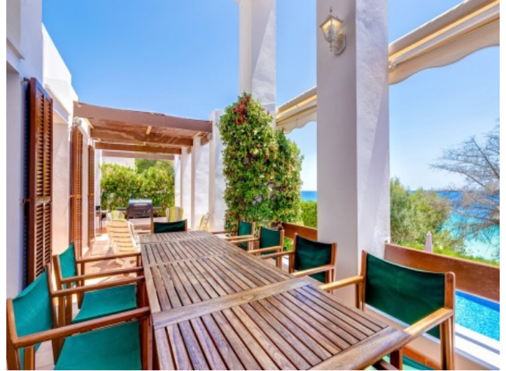
Großzügige Terrasse mit Essbereich und Grill