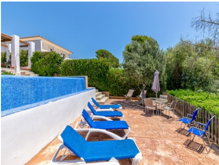
Loungebereich neben dem Pool