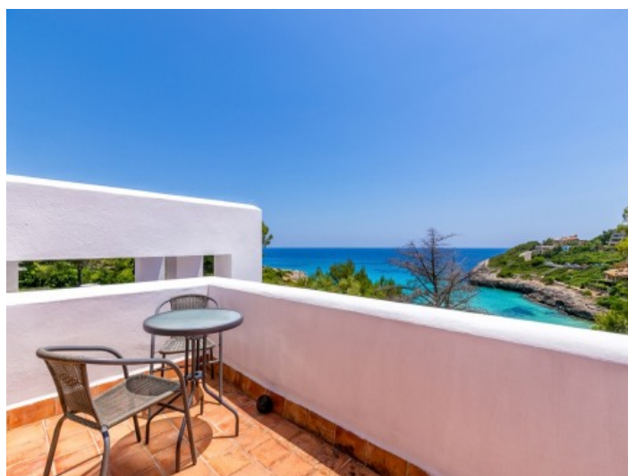
Terrasse mit fantastischem Ausblick auf das Meer

Alle Angaben nach bestem Wissen. Irrtum und Zwischenverkauf vorbehalten. Dieses Exposé ist eine Vorinformation, als Rechtsgrundlage gilt allein der notariell abgeschlossene Kaufvertrag.