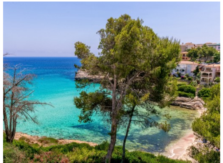
Wunderschöner Strand nahbei

Alle Angaben nach bestem Wissen. Irrtum und Zwischenverkauf vorbehalten. Dieses Exposé ist eine Vorinformation, als Rechtsgrundlage gilt allein der notariell abgeschlossene Kaufvertrag.