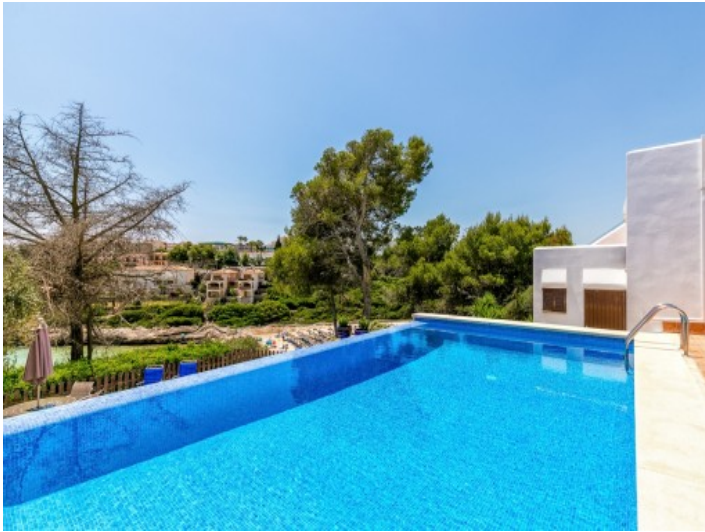
Großer Pool mit Blick auf den Strand