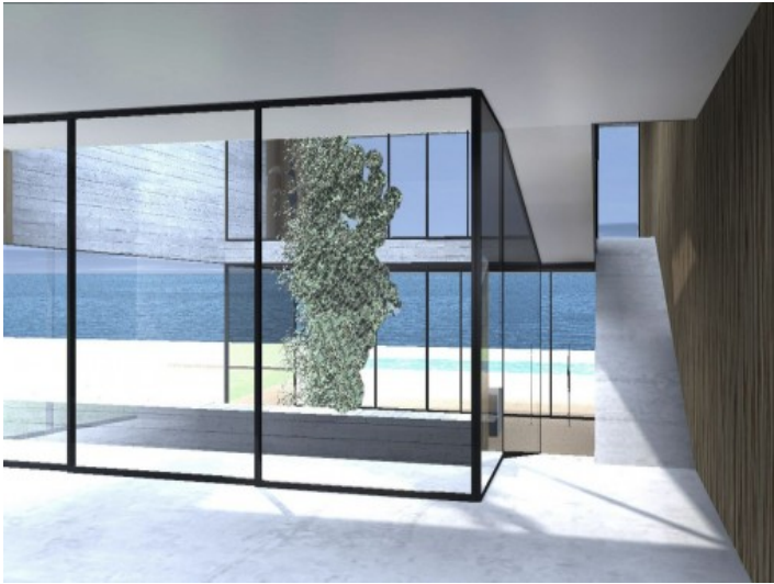
Die Villa bietet einen spektakulären Meerblick