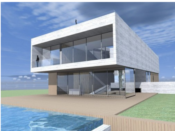
Moderne Villa im Bau in erster Meereslinie in Cala Pi