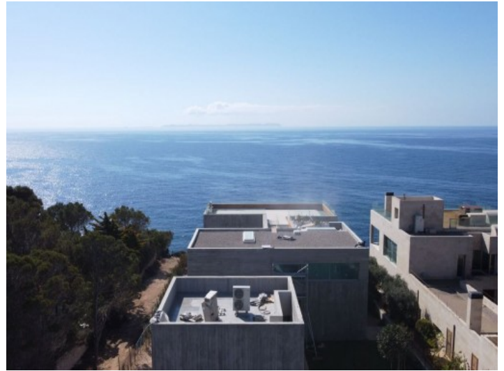
Blick zum Meer