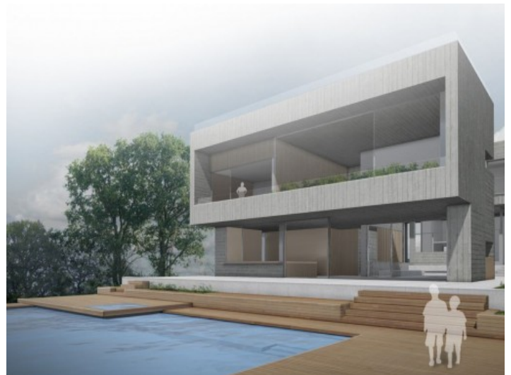
Alternative Ansicht der Villa

Alle Angaben nach bestem Wissen. Irrtum und Zwischenverkauf vorbehalten. Dieses Exposé ist eine Vorinformation, als Rechtsgrundlage gilt allein der notariell abgeschlossene Kaufvertrag.