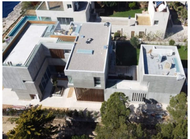
Außenansicht der Villa