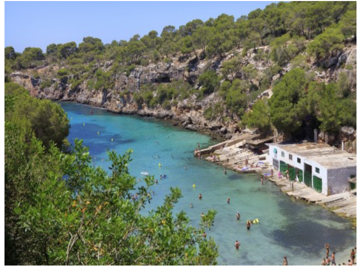
Die schöne Bucht von Cala Pi liegt in der Nähe