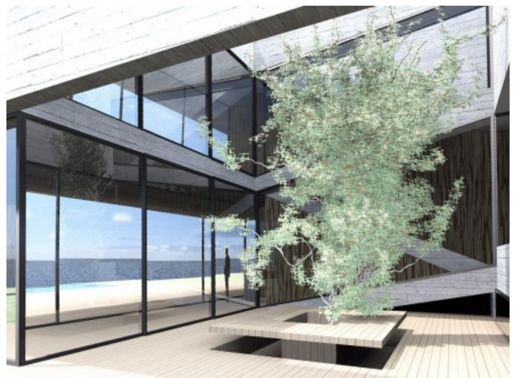
Modernes und elegantes Design

Alle Angaben nach bestem Wissen. Irrtum und Zwischenverkauf vorbehalten. Dieses Exposé ist eine Vorinformation, als Rechtsgrundlage gilt allein der notariell abgeschlossene Kaufvertrag.