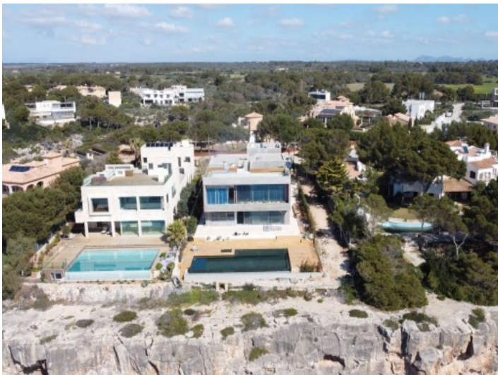
Außenansicht der Villa