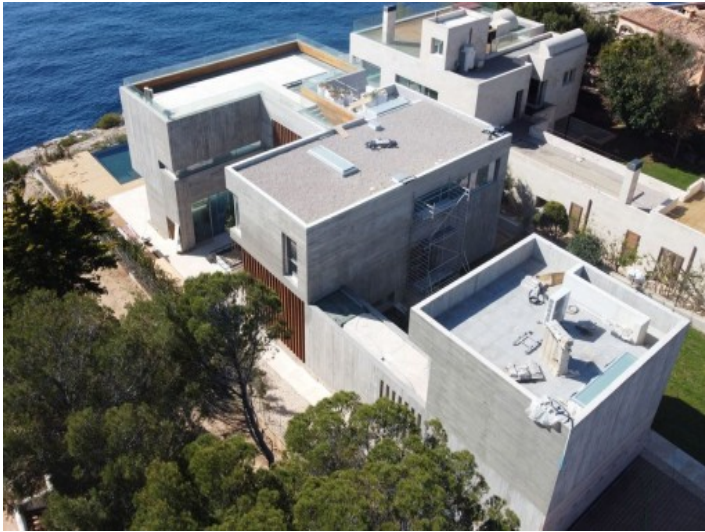
Außenansicht der Villa