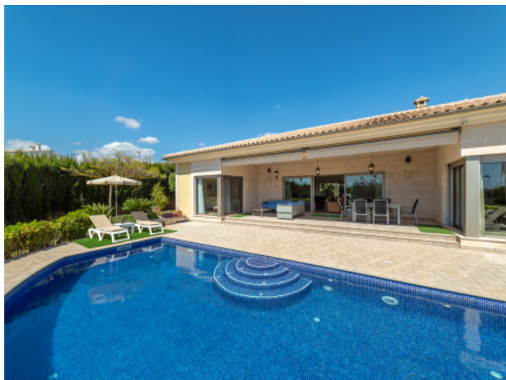
Villa und Pool