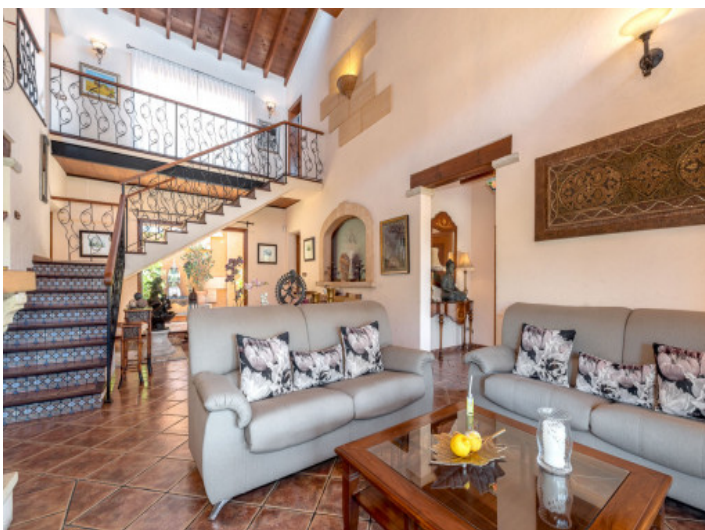
Offener Wohnbereich und Treppe