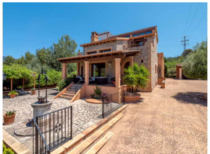
Außenbereich mit Terrassen

Alle Angaben nach bestem Wissen. Irrtum und Zwischenverkauf vorbehalten. Dieses Exposé ist eine Vorinformation, als Rechtsgrundlage gilt allein der notariell abgeschlossene Kaufvertrag.