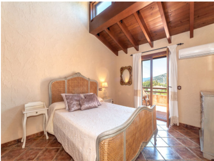
Eines von 5 Schlafzimmern