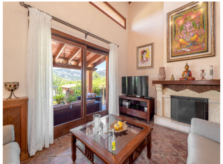
Wohnbereich mit Terrassenzugang