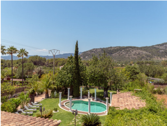
Blick auf den Pool und die Berge