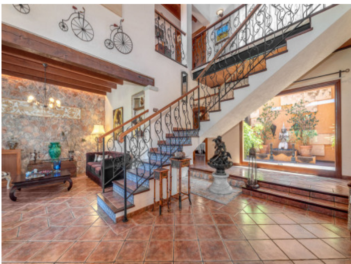
Eingangs- und Wohnbereich