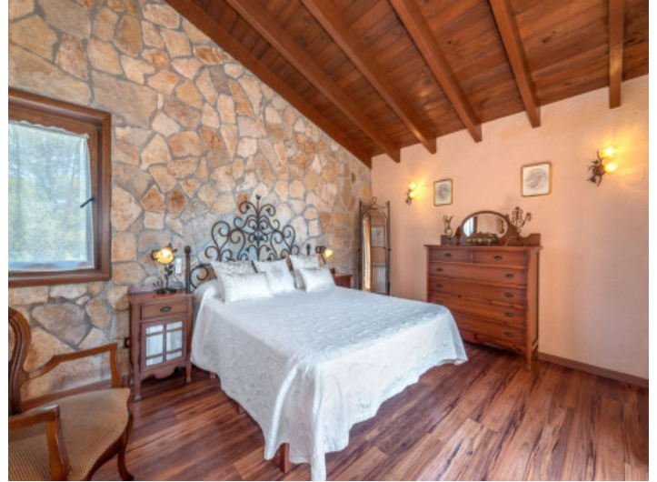
Eines von 5 Schlafzimmern