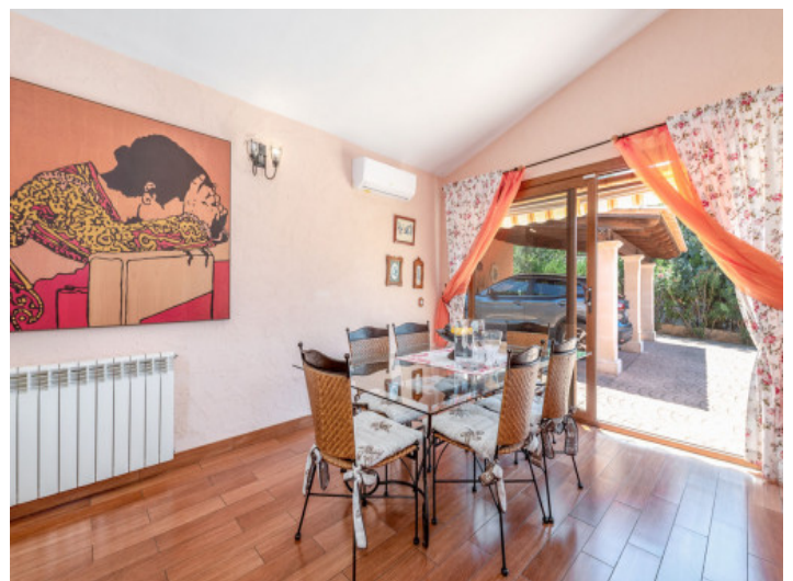
Essbereich mit Zugang nach Außen

Alle Angaben nach bestem Wissen. Irrtum und Zwischenverkauf vorbehalten. Dieses Exposé ist eine Vorinformation, als Rechtsgrundlage gilt allein der notariell abgeschlossene Kaufvertrag.