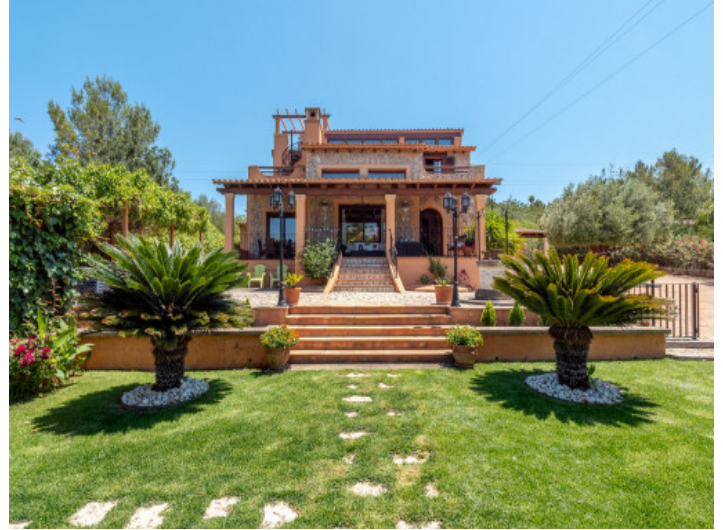
Außenansicht des Hauses vom Garten aus