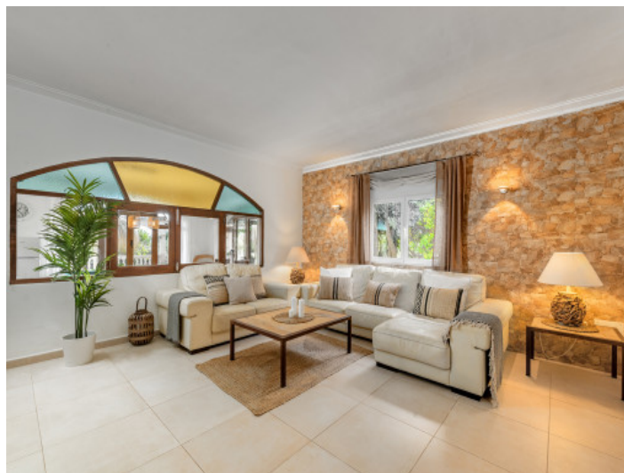
Wohnbereich mit Steinwand