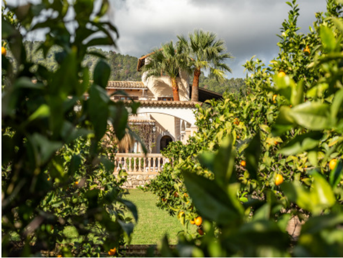
Finca und Garten