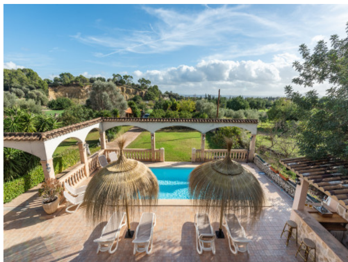
Blick über das Anwesen

Alle Angaben nach bestem Wissen. Irrtum und Zwischenverkauf vorbehalten. Dieses Exposé ist eine Vorinformation, als Rechtsgrundlage gilt allein der notariell abgeschlossene Kaufvertrag.