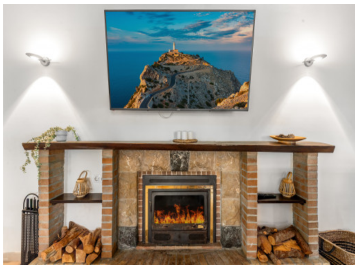
Gemütlicher Kamin für Wintertage