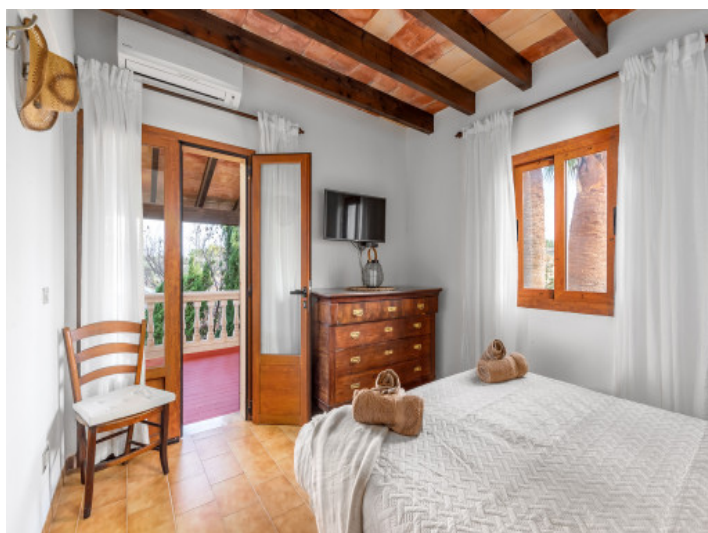
Schlafzimmer mit Terrassenzugang