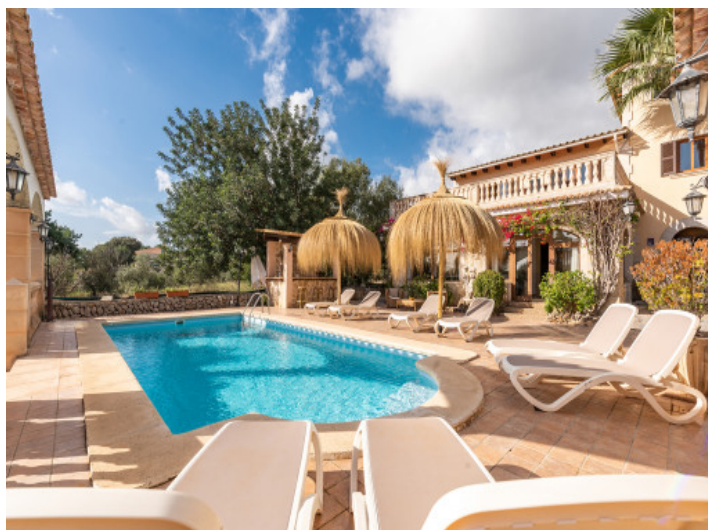
Blick vom Pool zum Haus