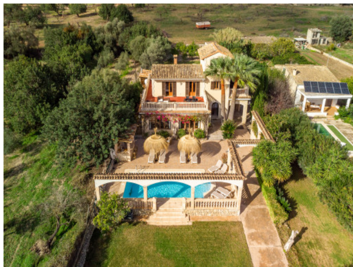
Traumhafte Villa mit Ferienvermietlizenz in exponierter Lage bei Selva