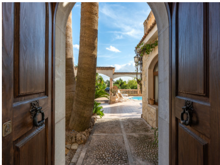
Eingang zum Haus