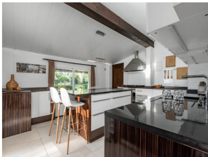
Große, moderne Küche

Alle Angaben nach bestem Wissen. Irrtum und Zwischenverkauf vorbehalten. Dieses Exposé ist eine Vorinformation, als Rechtsgrundlage gilt allein der notariell abgeschlossene Kaufvertrag.