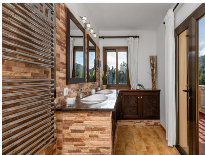
Badezimmer mit Terrassenzugang