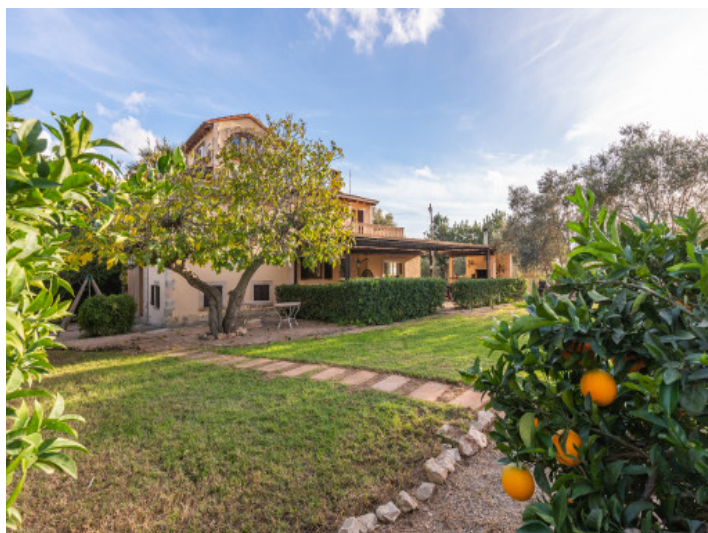
Garten mit Obstbäumen