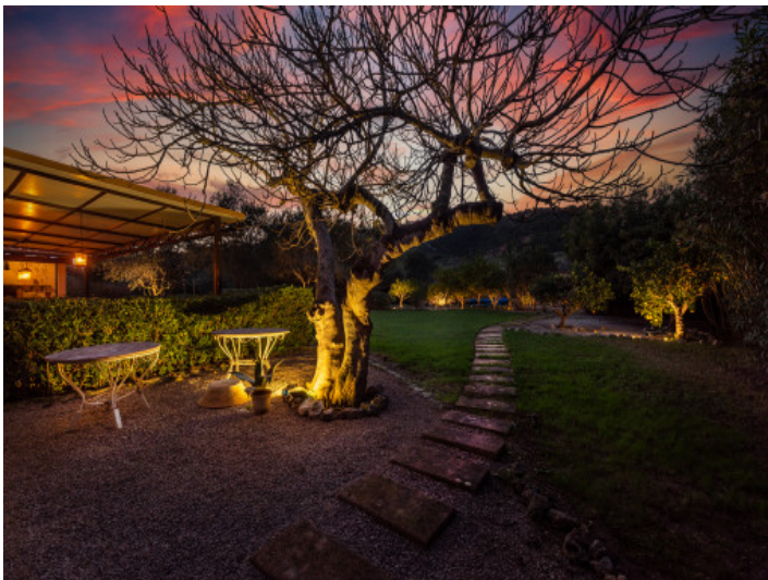
Blick in den Garten bei Nacht