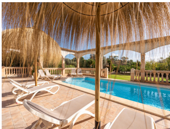
Pooloase mit Blick in den Garten