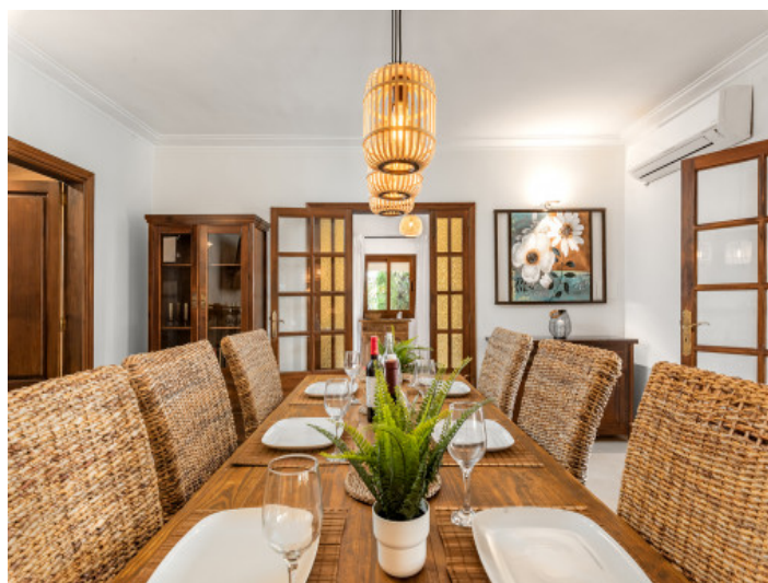
Essbereich im Zentrum des Raumes