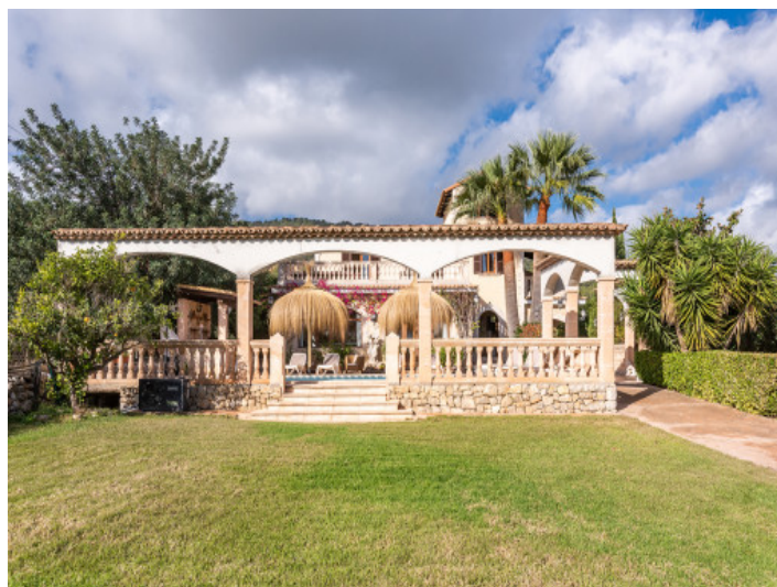
Finca und Garten

Alle Angaben nach bestem Wissen. Irrtum und Zwischenverkauf vorbehalten. Dieses Exposé ist eine Vorinformation, als Rechtsgrundlage gilt allein der notariell abgeschlossene Kaufvertrag.