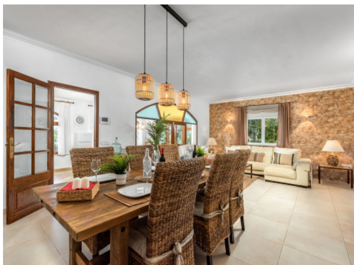
Offener Wohn-und Essbereich