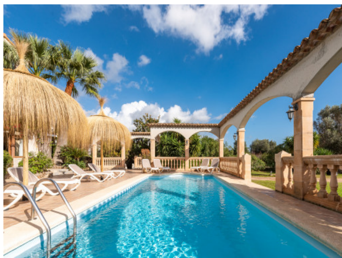
Traumhafte Villa mit Ferienvermietlizenz in exponierter Lage bei Selva