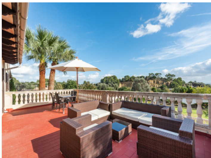
Obere Terrasse mit Ausblick