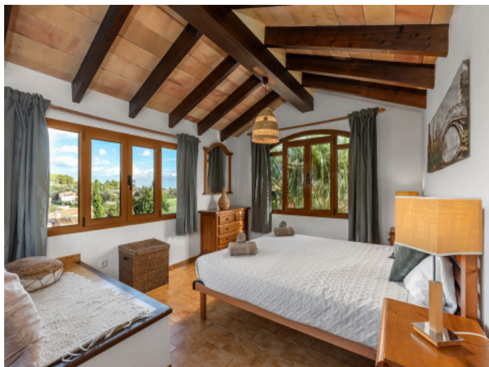
Schlafzimmer mit Holzbalkendecke