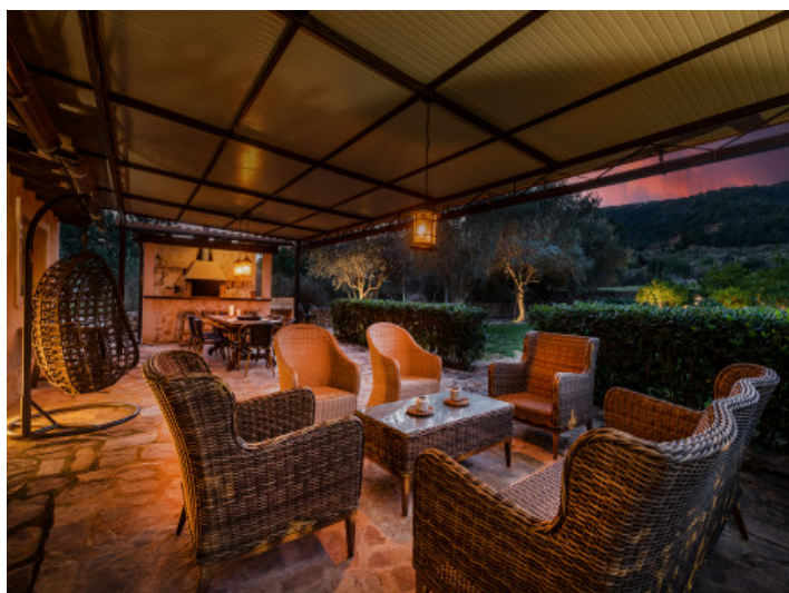
Abendstimmung auf der Terrasse