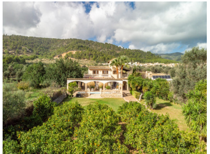
Die Finca aus der Vogelperspektive