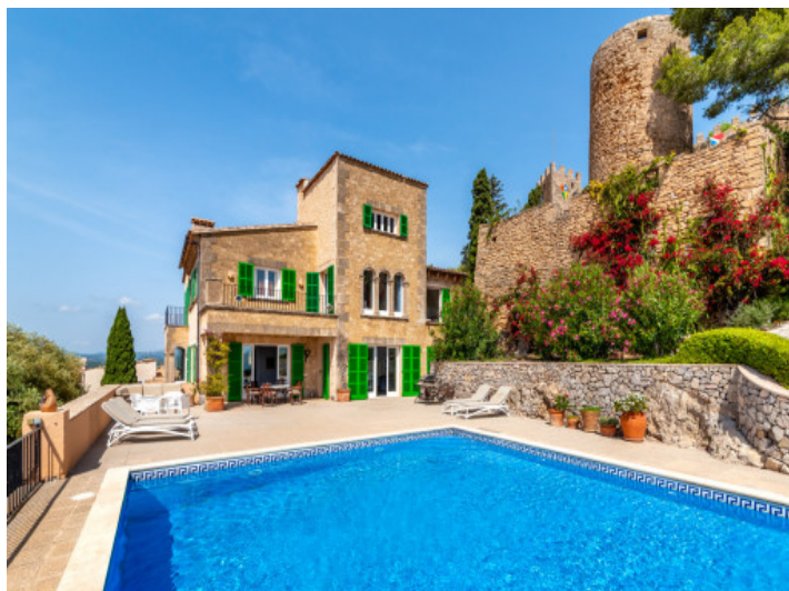
Exklusiver Palazzo mit Pool und Weitblick in Capdepera