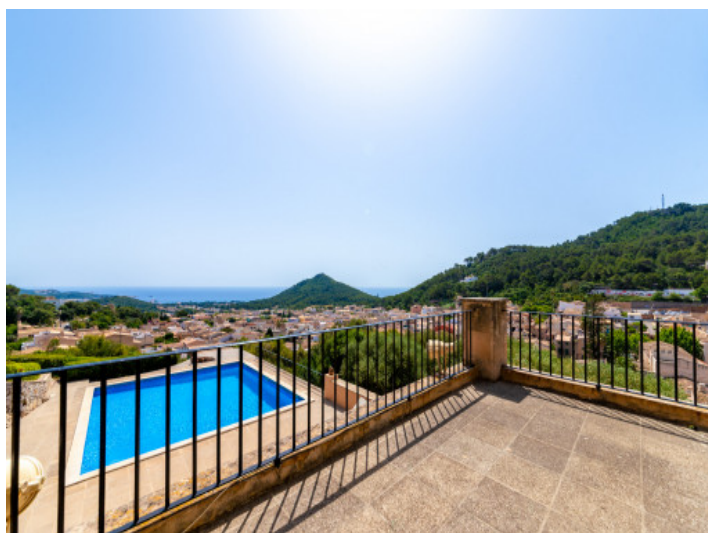
Sonnterrasse mit Aussicht