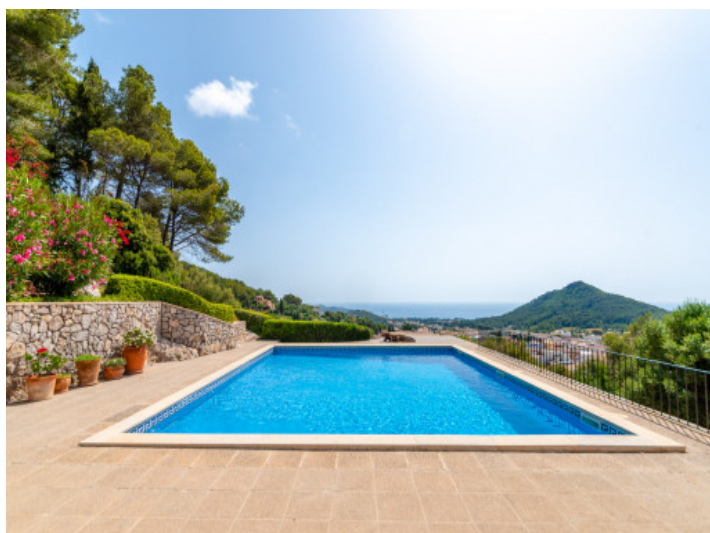
Sehr gepflegter Poolbereich