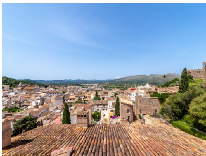
Blick über die Dächer des Dorfes