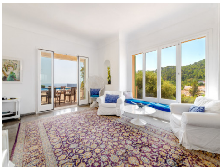
Lichtdurchfluteter Wohnbereich mit Ausblick