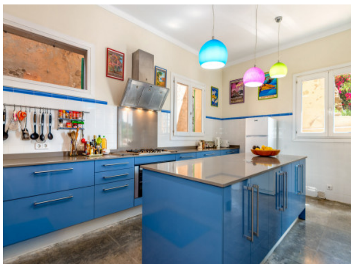
Komplett ausgestattete Küche