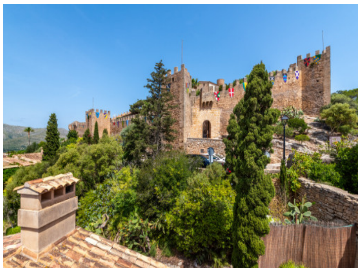
Blick auf das Schloss

Alle Angaben nach bestem Wissen. Irrtum und Zwischenverkauf vorbehalten. Dieses Exposé ist eine Vorinformation, als Rechtsgrundlage gilt allein der notariell abgeschlossene Kaufvertrag.