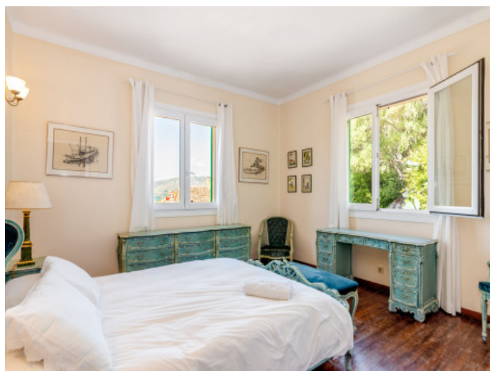
Eines von 8 Schlafzimmern