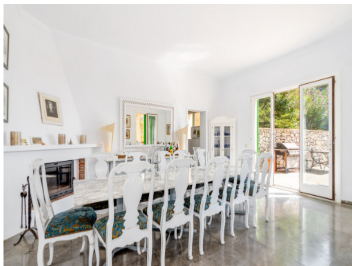
Schöner Essbereich mit Kamin

Alle Angaben nach bestem Wissen. Irrtum und Zwischenverkauf vorbehalten. Dieses Exposé ist eine Vorinformation, als Rechtsgrundlage gilt allein der notariell abgeschlossene Kaufvertrag.