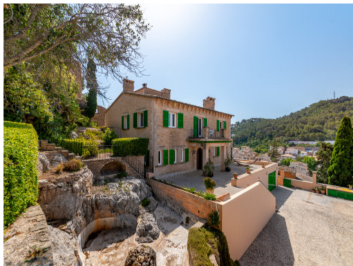
Frontansicht des Palazzos