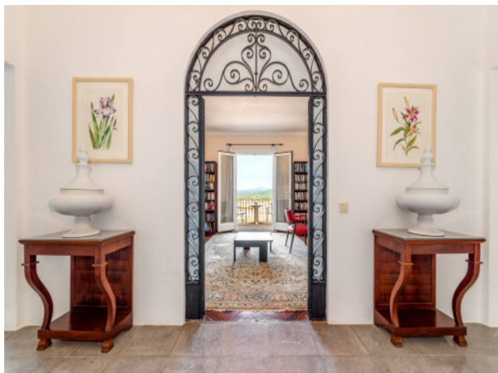
Eingang zum Arbeitszimmer