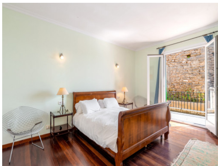
Eines von 8 Schlafzimmern