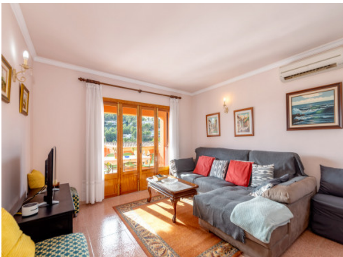
Wohnbereich mit Terrassenzugang