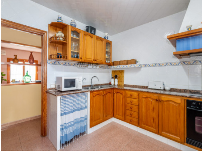
Küche im Landhausstil