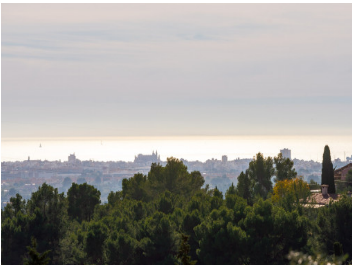
Panoramablick bis auf Palma