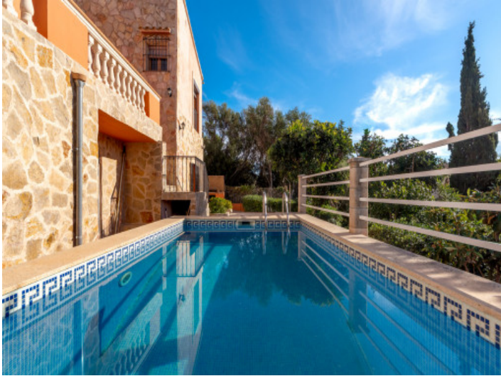
Erfrischender Pool für Sommertage