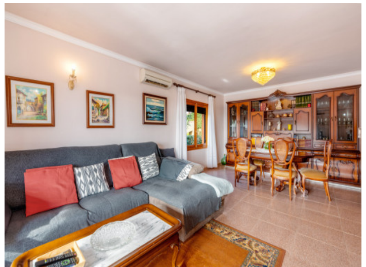
Geräumiger Wohn- und Essbereich

Alle Angaben nach bestem Wissen. Irrtum und Zwischenverkauf vorbehalten. Dieses Exposé ist eine Vorinformation, als Rechtsgrundlage gilt allein der notariell abgeschlossene Kaufvertrag.