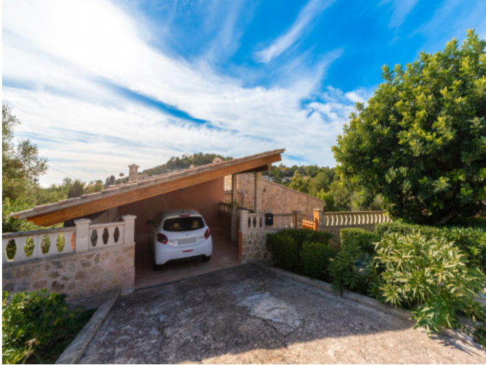
Garage und Zufahrt