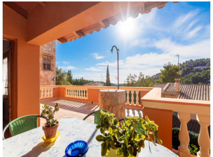
Teilweise überdachter Essbereich