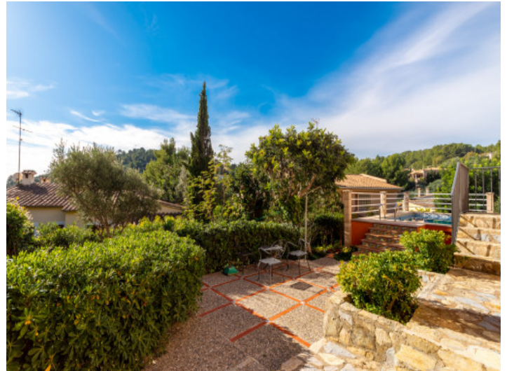
Herrlicher Garten mit Terrasse