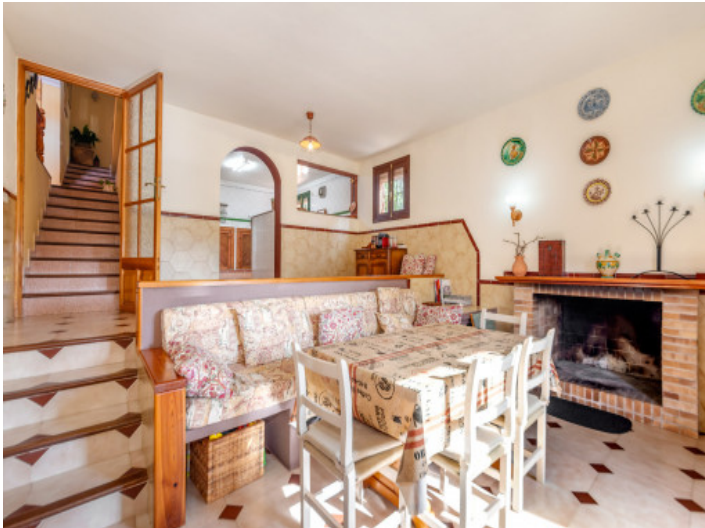
Rustikaler Kaminraum mit Essbereich