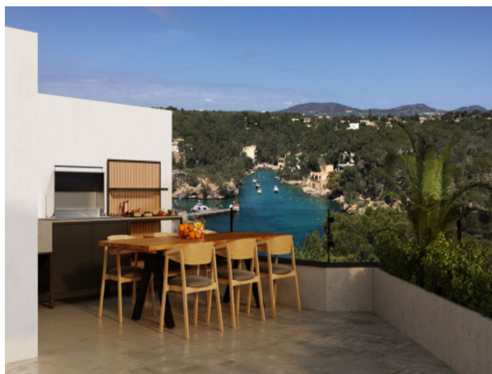
Bbq Dachterrasse mit Meerblick