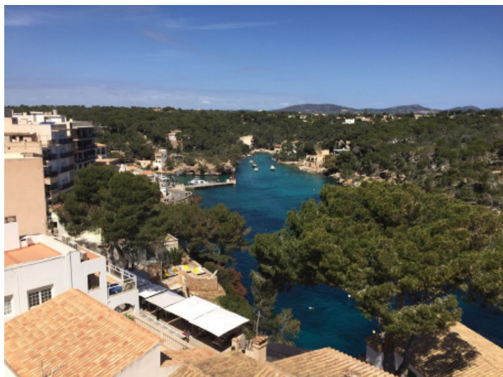
Lage des Hauses