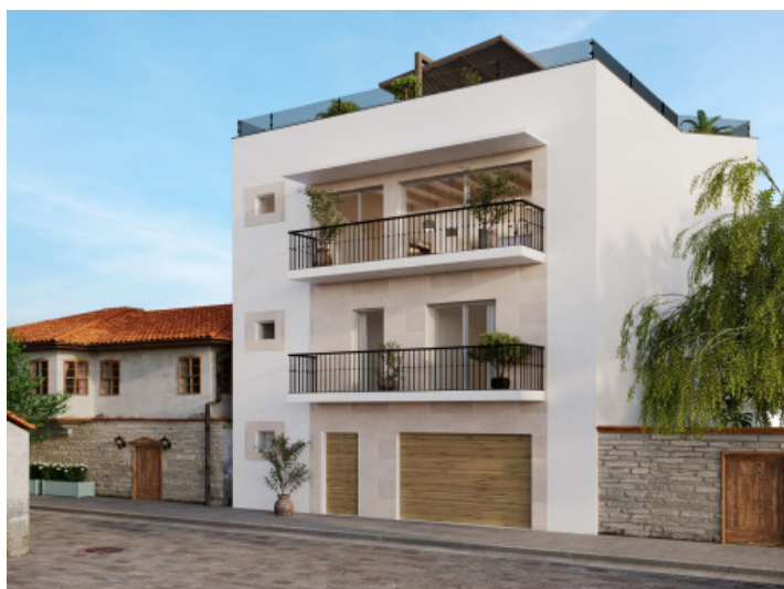
Außenansicht des Hauses