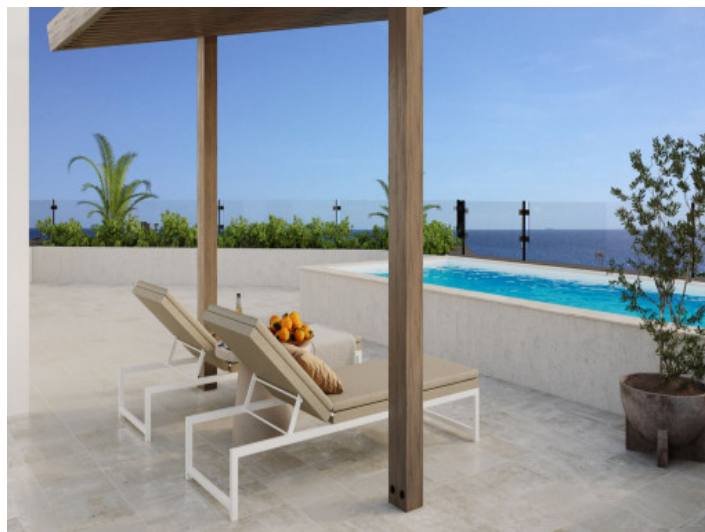
Fantastische Terrasse mit Pool