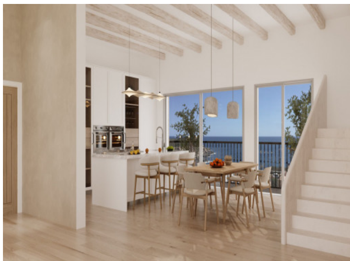
Küche mit Meerblick