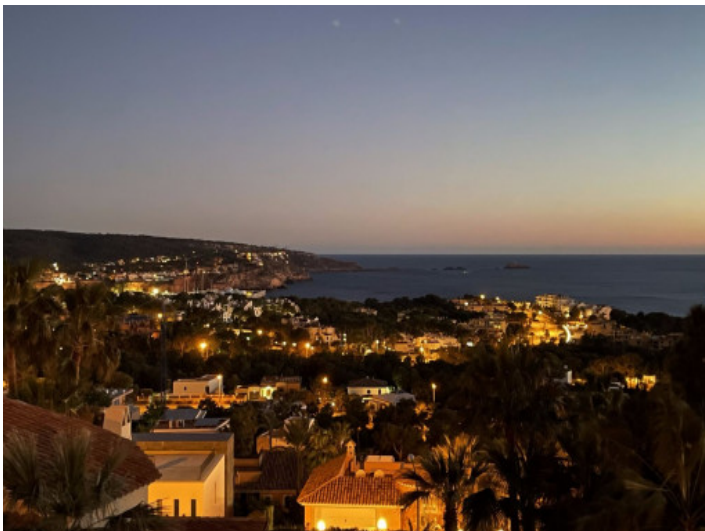
Blick über Santa Ponsa bei Nacht

Alle Angaben nach bestem Wissen. Irrtum und Zwischenverkauf vorbehalten. Dieses Exposé ist eine Vorinformation, als Rechtsgrundlage gilt allein der notariell abgeschlossene Kaufvertrag.