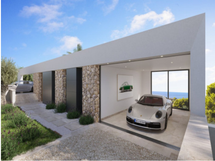
Garage mit Blick auf das Mittelmeer