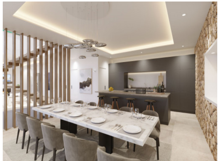
Offene Küche und Essbereich