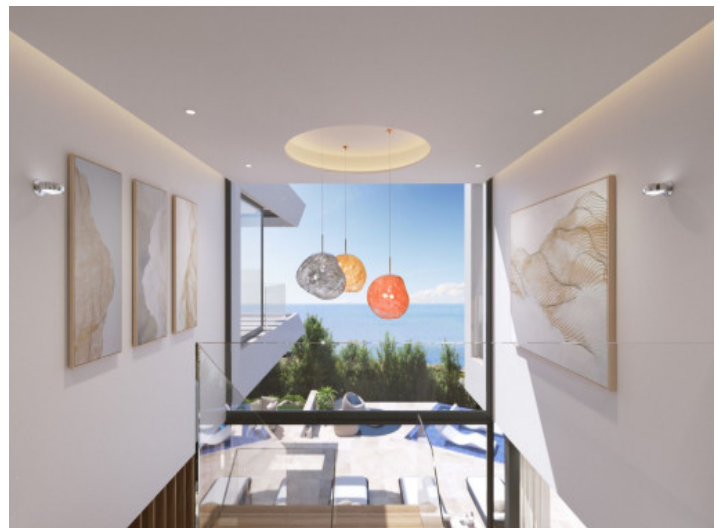
Galerie mit Meerblick

Alle Angaben nach bestem Wissen. Irrtum und Zwischenverkauf vorbehalten. Dieses Exposé ist eine Vorinformation, als Rechtsgrundlage gilt allein der notariell abgeschlossene Kaufvertrag.