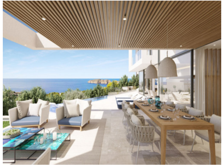
Überdachte Terrasse mit Lounge- und Essbereich