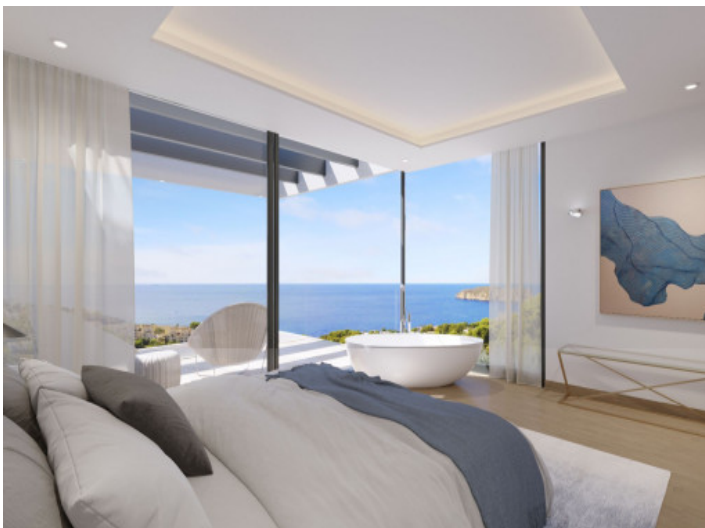
Schlafzimmer mit Balkonzugang und Badewanne