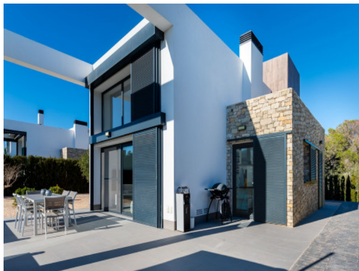
Außenansicht und Terrasse