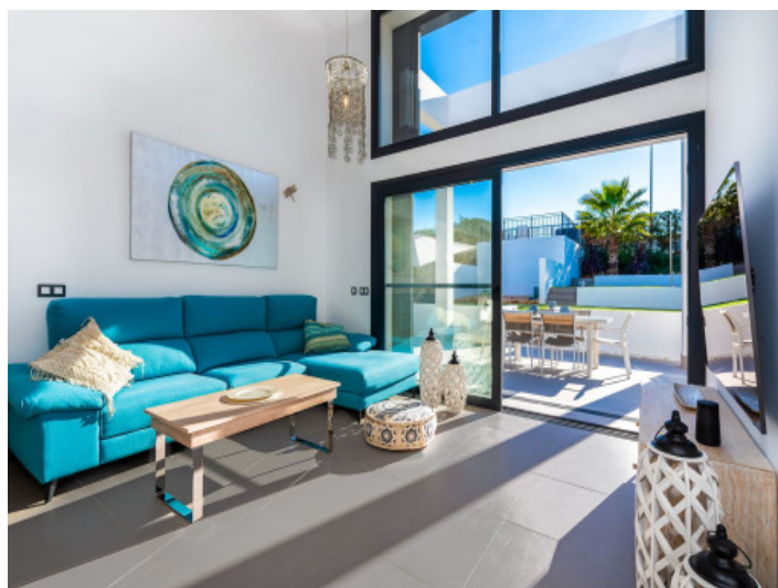
Wohnbereich mit Fensterfront