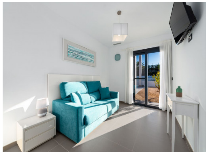
Schlafzimmer mit Terrassenzugang

Alle Angaben nach bestem Wissen. Irrtum und Zwischenverkauf vorbehalten. Dieses Exposé ist eine Vorinformation, als Rechtsgrundlage gilt allein der notariell abgeschlossene Kaufvertrag.