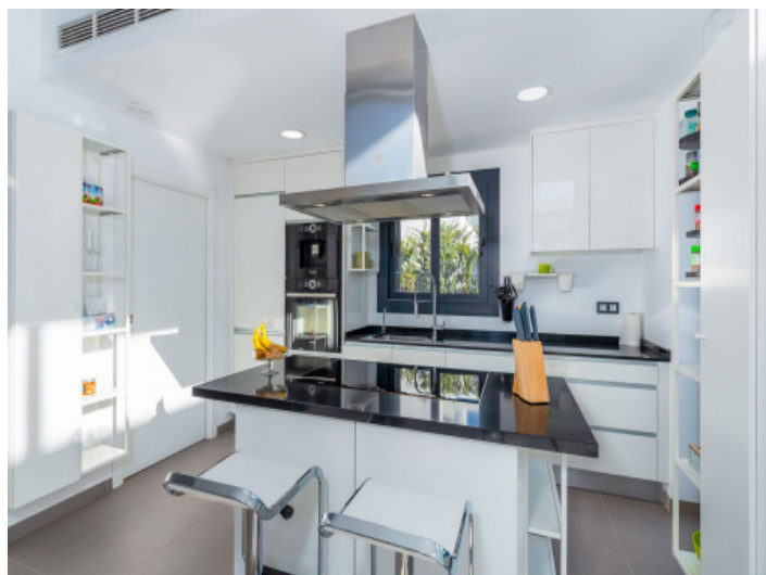
Moderne Amerikanische Küche

Alle Angaben nach bestem Wissen. Irrtum und Zwischenverkauf vorbehalten. Dieses Exposé ist eine Vorinformation, als Rechtsgrundlage gilt allein der notariell abgeschlossene Kaufvertrag.