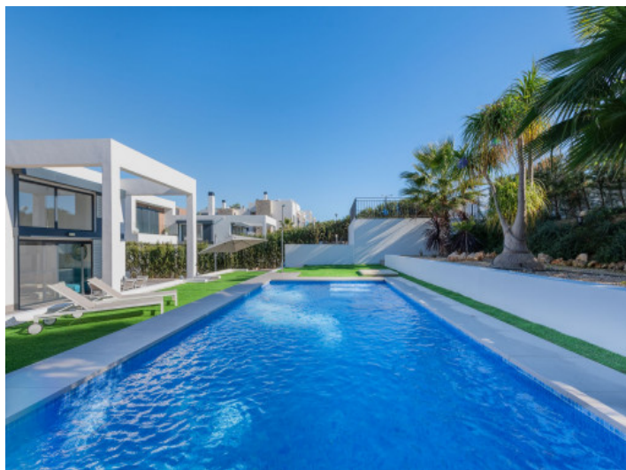
Großer Pool mit Sonnenterrasse