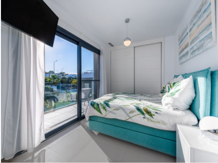
Schlafzimmer im Obergeschoss