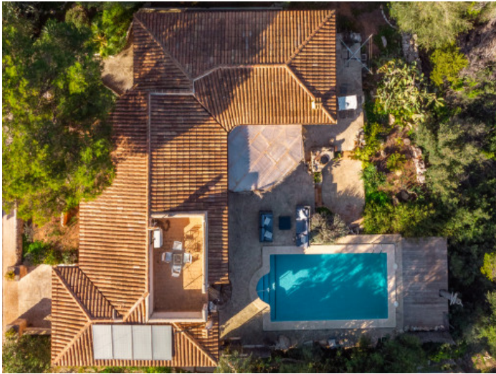
Ansicht von oben