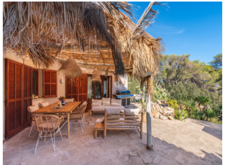
Idyllische Terrasse mit Ess- und Loungebereich