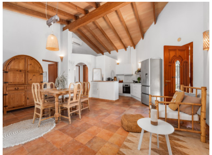
Ess- und Küchenbereich

Alle Angaben nach bestem Wissen. Irrtum und Zwischenverkauf vorbehalten. Dieses Exposé ist eine Vorinformation, als Rechtsgrundlage gilt allein der notariell abgeschlossene Kaufvertrag.