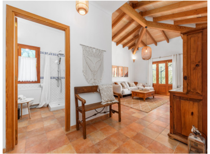
Wohnbereich und Flur