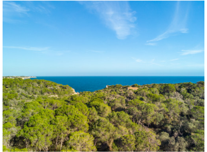
Fantastischer Blick bis zum Meer