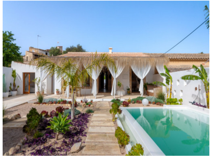
Tolle Villa mit Pool und Garten in Establiments