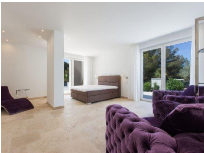
Hauptschlafzimmer mit Doppelbett