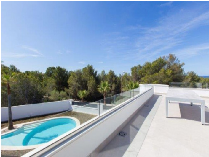
Balkon mit Poolblick