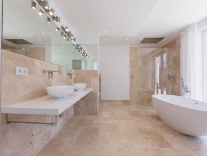
Nobles Badezimmer mit Badewanne