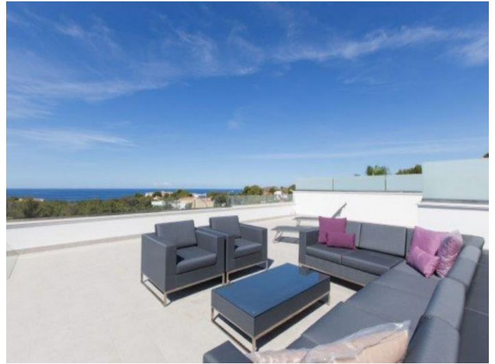
Sitzecke auf der großflächigen Dachterrasse