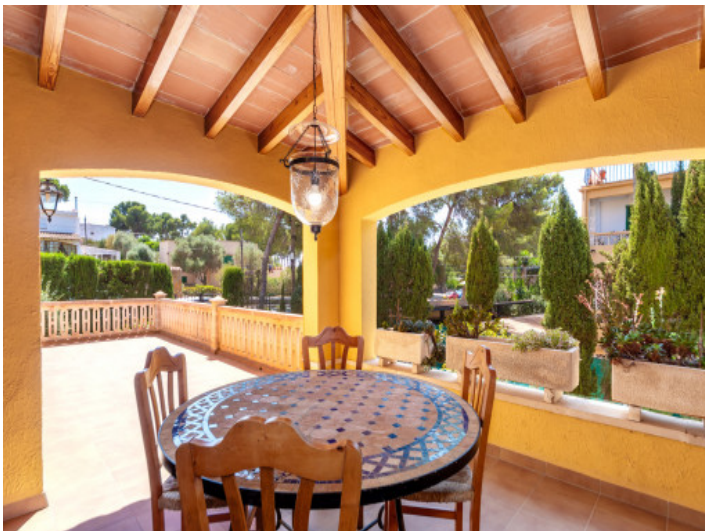
Ein weitere Terrasse