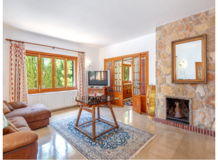
Ein weiterer Wohnbereich im OG