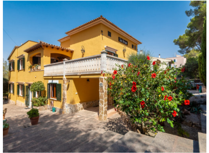
Blick auf das Haus