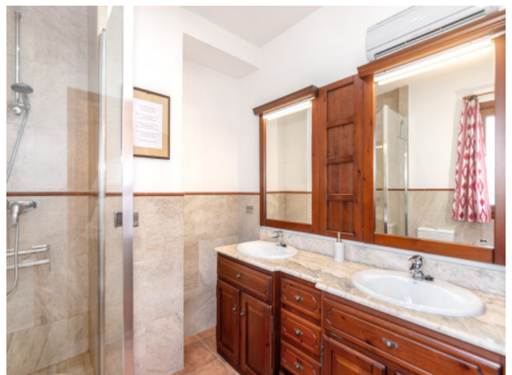
Eines von 4 Badezimmern

Alle Angaben nach bestem Wissen. Irrtum und Zwischenverkauf vorbehalten. Dieses Exposé ist eine Vorinformation, als Rechtsgrundlage gilt allein der notariell abgeschlossene Kaufvertrag.