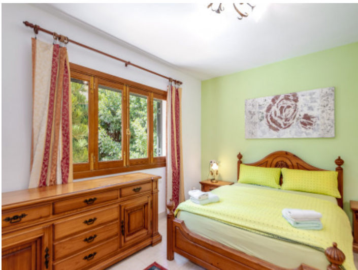
Eines von 7 Schlafzimmern