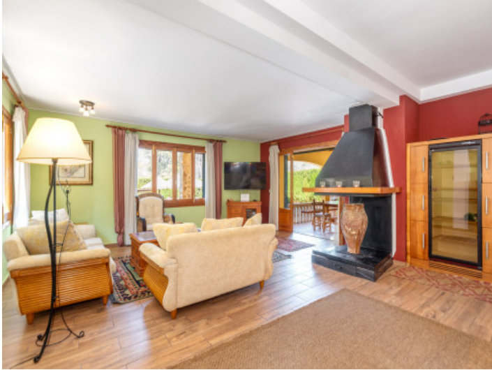
Wohnbereich mit Kamin