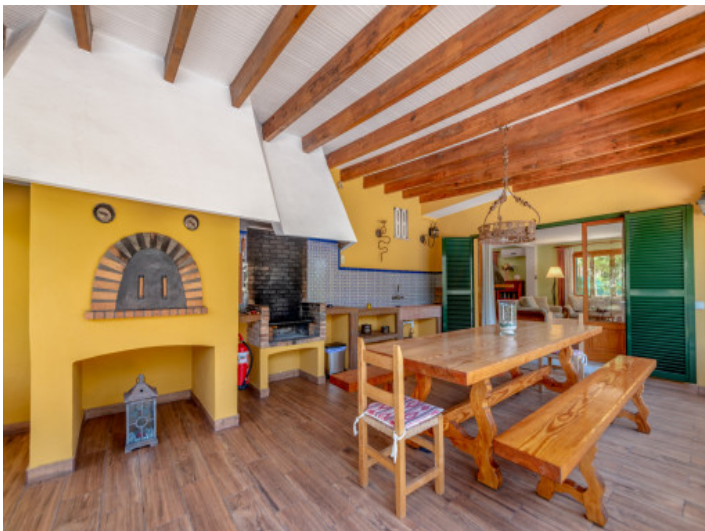
Terrasse mit Grillbereich