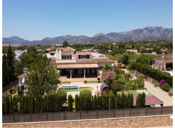
Ansicht auf dieses schöne Einfamilienhaus