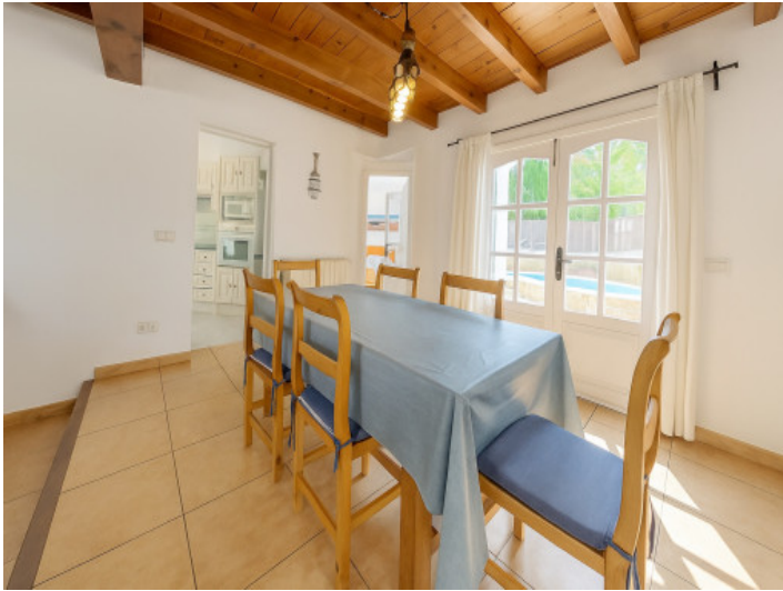
Essbereich mit Terrassenzugang