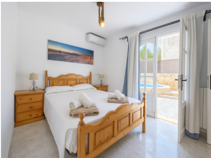
Suite im Erdgeschoss