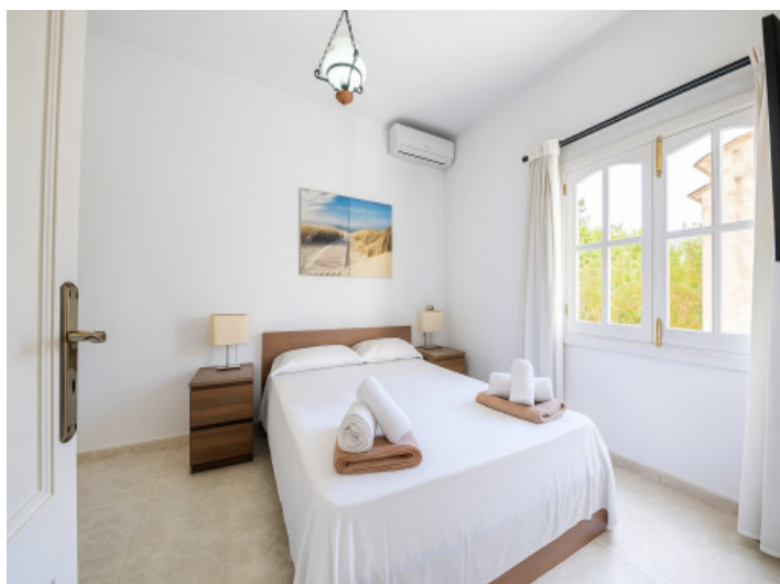
Zweites Schlafzimmer im Obergeschoss