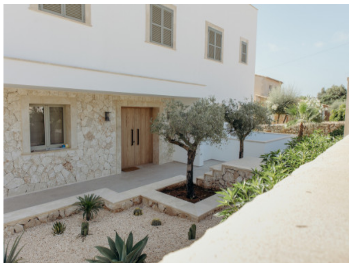
Vorderansicht der Villa

Alle Angaben nach bestem Wissen. Irrtum und Zwischenverkauf vorbehalten. Dieses Exposé ist eine Vorinformation, als Rechtsgrundlage gilt allein der notariell abgeschlossene Kaufvertrag.