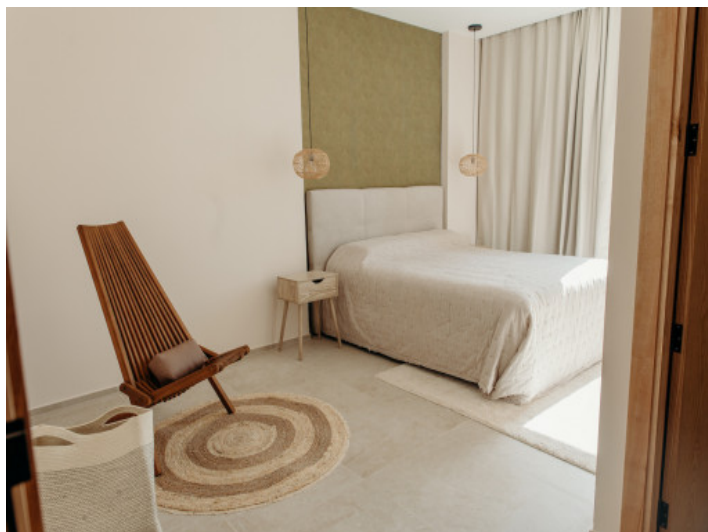
Eines von 4 Schlafzimmern