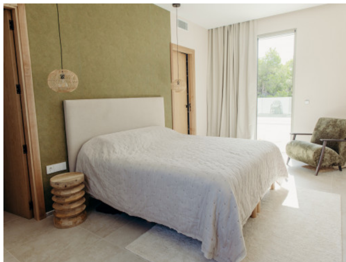
Eines von 4 Schlafzimmern