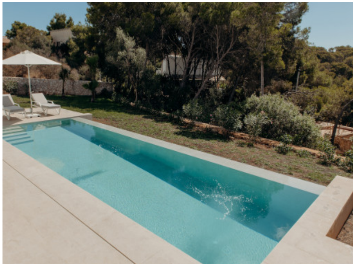
Pool mit Sonnenterrasse