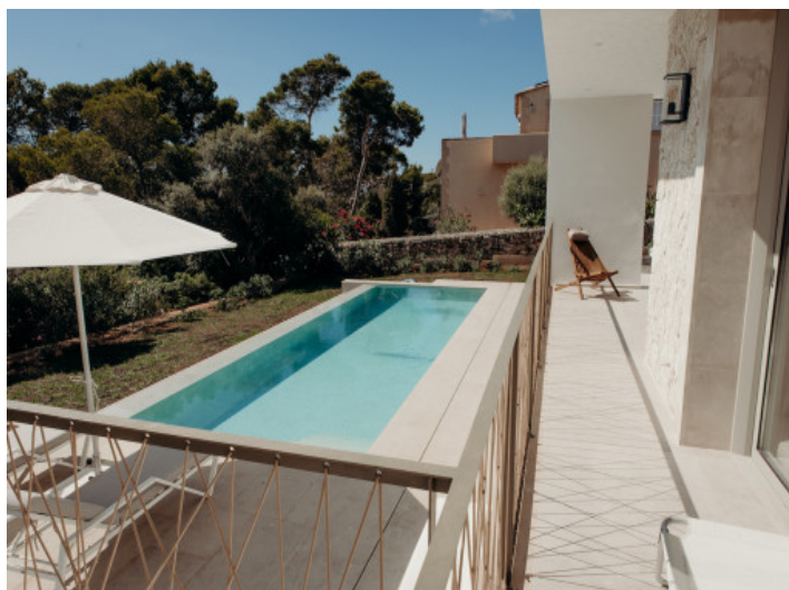
Blick auf den Pool