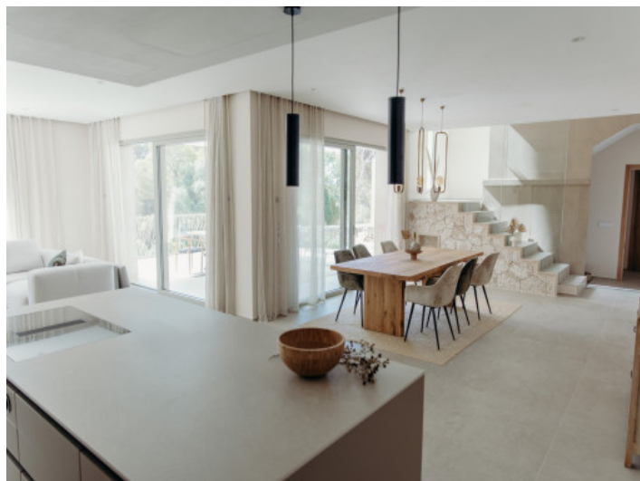
Offener Wohn-und Essbereich