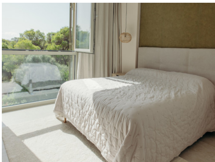
Eines von 4 Schlafzimmern