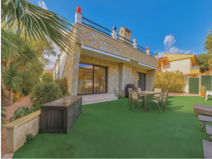
Großzügige Terrassen vor dem Wohnzimmer