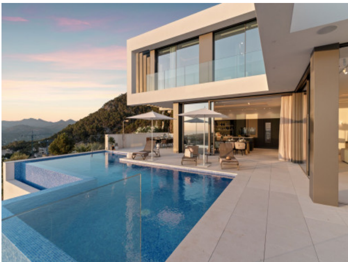
Großzügige Terrasse und Außenbereich