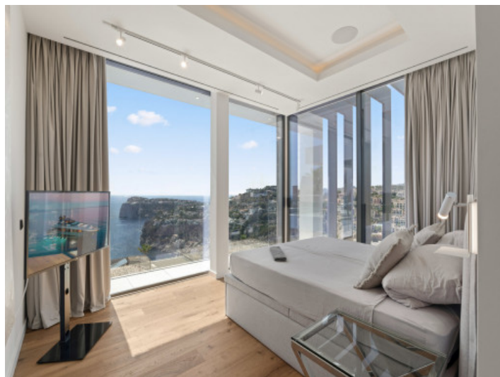
Schlafzimmer mit bodentiefen Fenstern