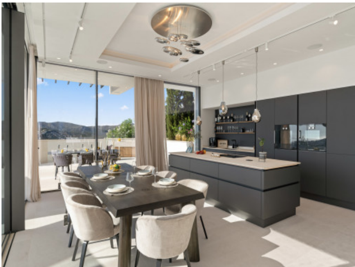
Designer-Küche mit stylischem Essbereich