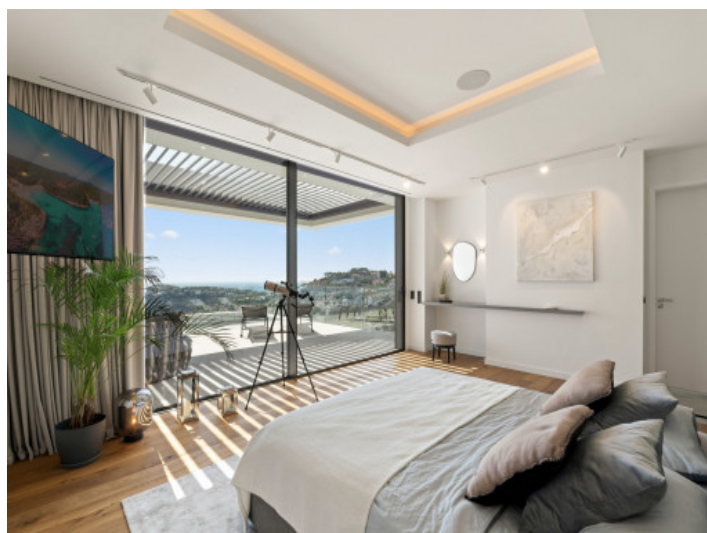
Eines der 5 Schlafzimmer