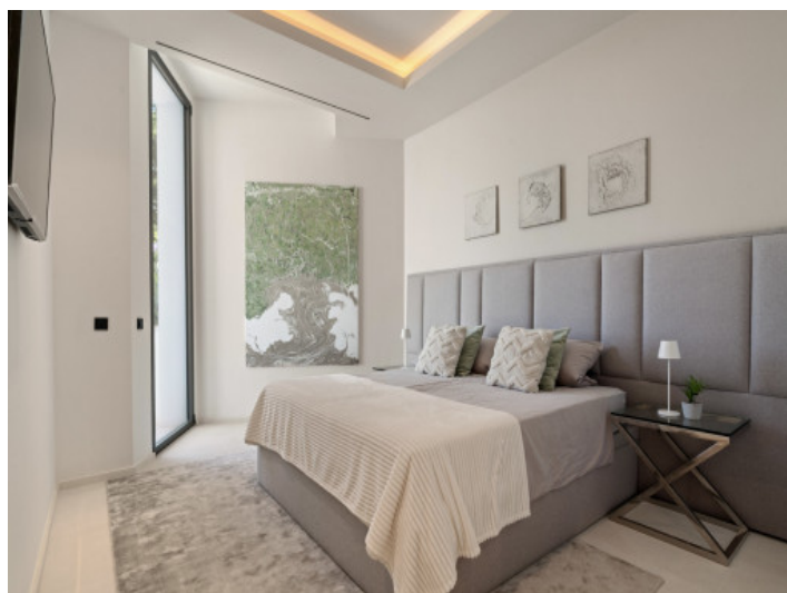
Eines der 5 Schlafzimmer