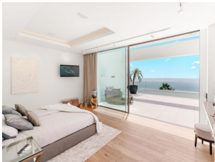
Schlafzimmer mit Terrassenzugang