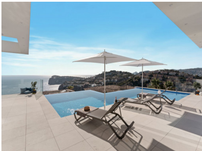
Terrasse mit Meerblick