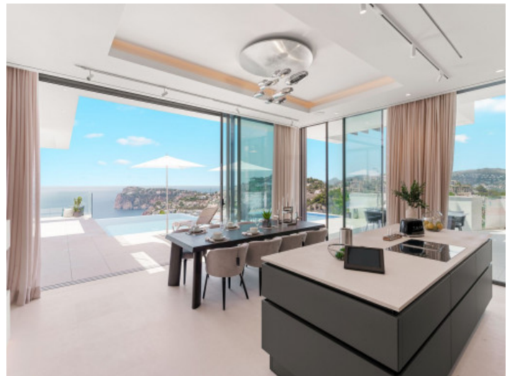
Essbereich mit fantastischem Ausblick