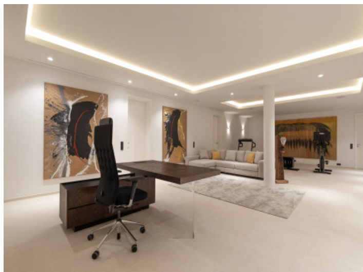
Büro und Fitnessraum

Alle Angaben nach bestem Wissen. Irrtum und Zwischenverkauf vorbehalten. Dieses Exposé ist eine Vorinformation, als Rechtsgrundlage gilt allein der notariell abgeschlossene Kaufvertrag.