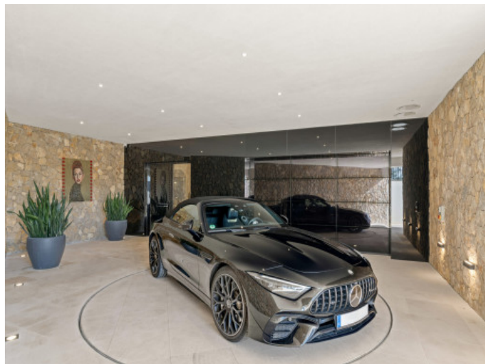
Hauseingang mit Drehplattform

Alle Angaben nach bestem Wissen. Irrtum und Zwischenverkauf vorbehalten. Dieses Exposé ist eine Vorinformation, als Rechtsgrundlage gilt allein der notariell abgeschlossene Kaufvertrag.