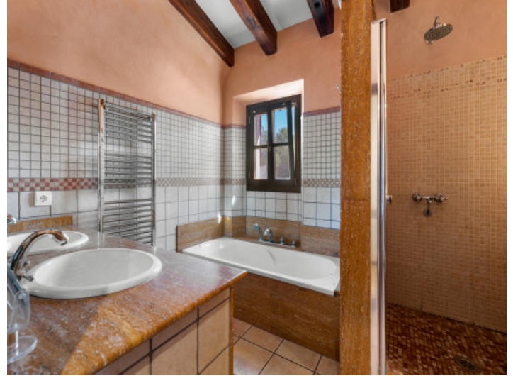
Badezimmer im Obergeschoss