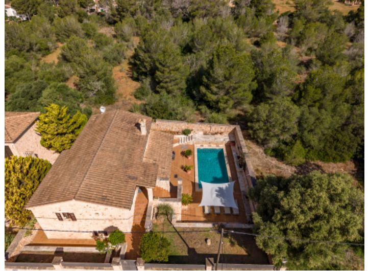
Direkt angrenzend an ein unverbaubares Waldgrundstück gelegen