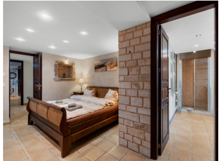
Masterbedroom mit Bad en Suite