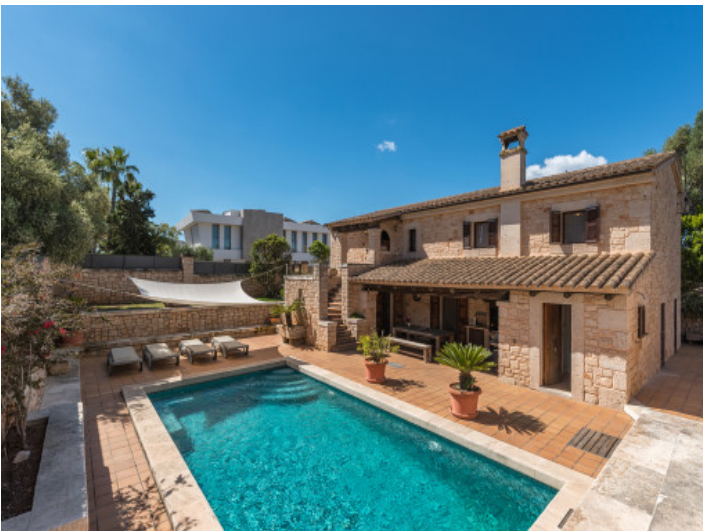
Terrasse und Pool befinden sich auf einer leicht tiefer gelegenen Ebene