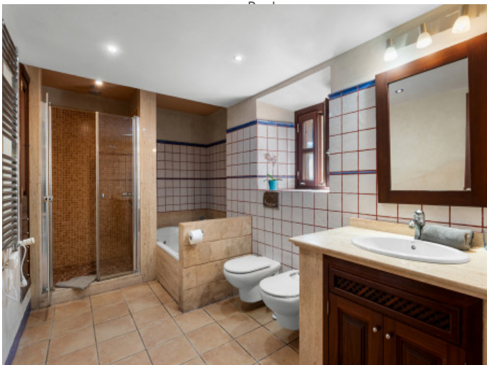
Badezimmer des Masterbedrooms