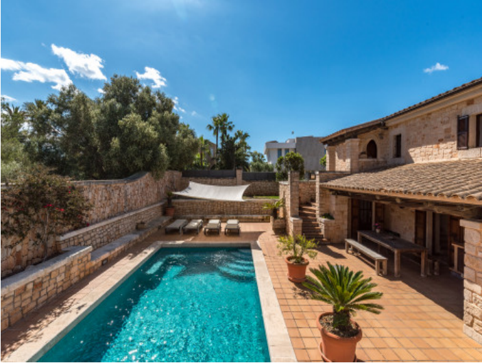
Terrasse und Pool befinden sich auf einer leicht tiefer gelegenen Ebene