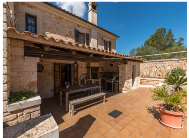
Überdachte Terrasse direkt am Haus mit Zugang zum Erdgeschoss

Alle Angaben nach bestem Wissen. Irrtum und Zwischenverkauf vorbehalten. Dieses Exposé ist eine Vorinformation, als Rechtsgrundlage gilt allein der notariell abgeschlossene Kaufvertrag.