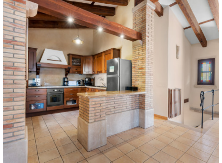
Küche angrenzend an den Wohnbereich