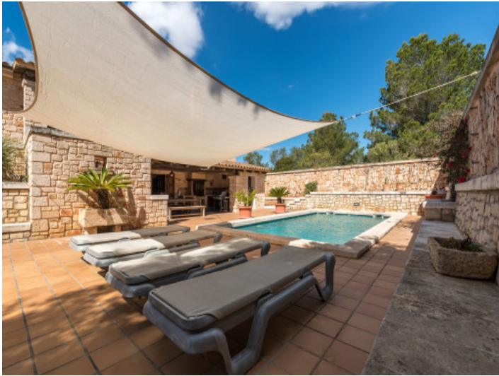
Sonnterrasse am Pool