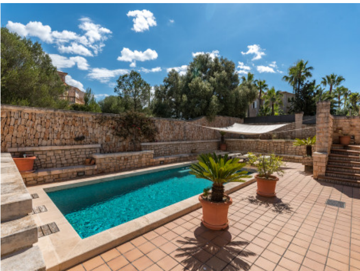
Pool mit integrierter, gemauerter Sitzecke