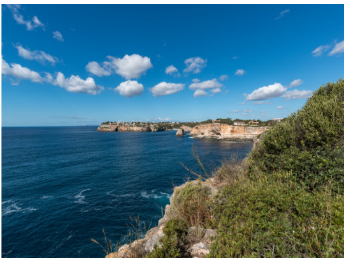
Blick Richtung Es Pontàs