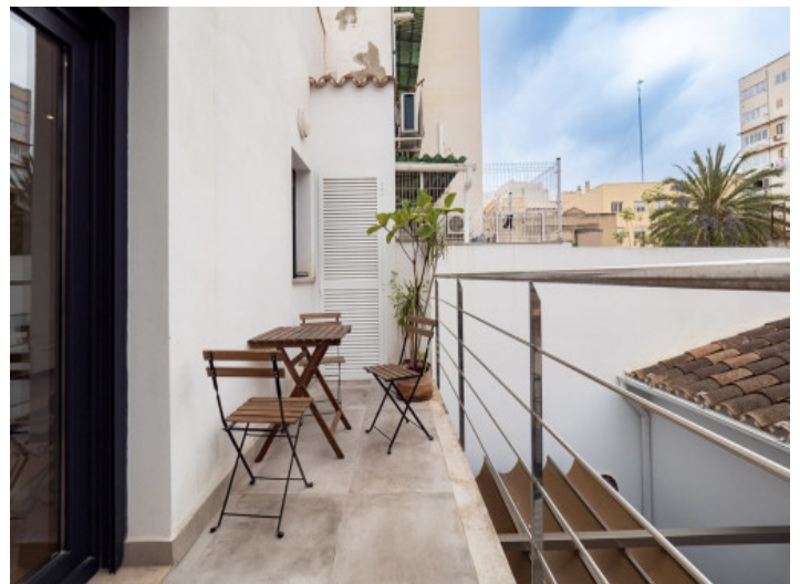
Balkon auf der Wohnebene

Alle Angaben nach bestem Wissen. Irrtum und Zwischenverkauf vorbehalten. Dieses Exposé ist eine Vorinformation, als Rechtsgrundlage gilt allein der notariell abgeschlossene Kaufvertrag.