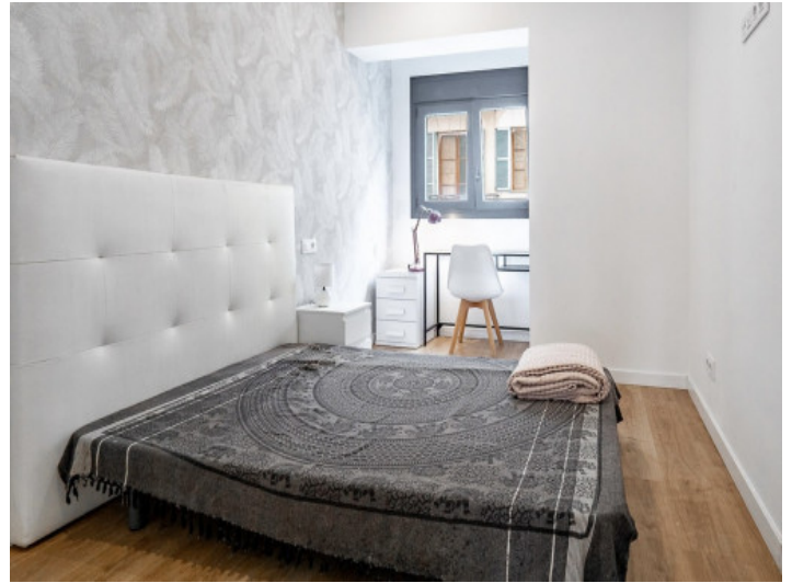
Eines von 2 Schlafzimmern