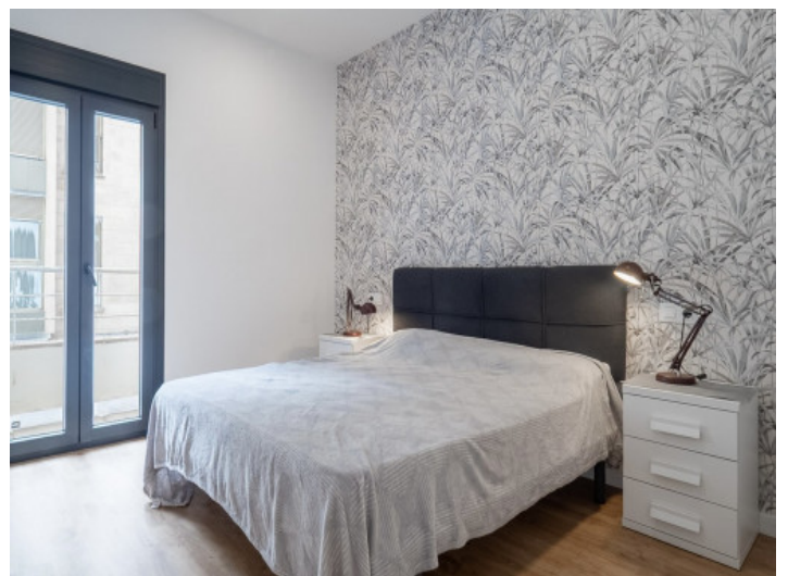
Eines von 2 Schlafzimmern

Alle Angaben nach bestem Wissen. Irrtum und Zwischenverkauf vorbehalten. Dieses Exposé ist eine Vorinformation, als Rechtsgrundlage gilt allein der notariell abgeschlossene Kaufvertrag.