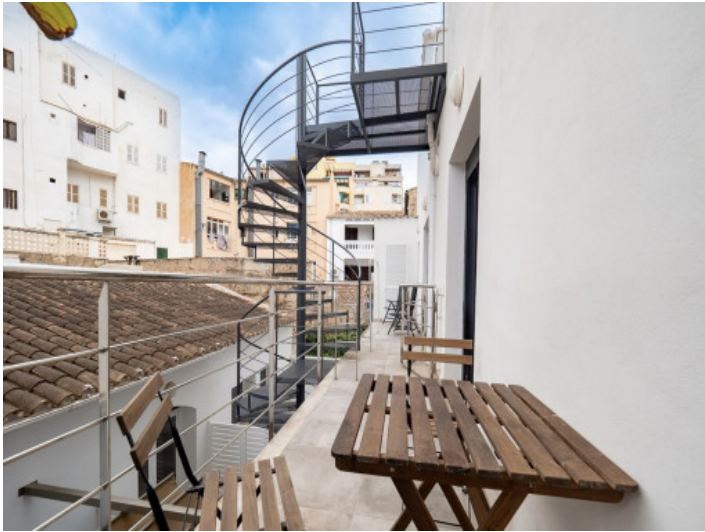
Wendeltreppe zur Dachterrasse