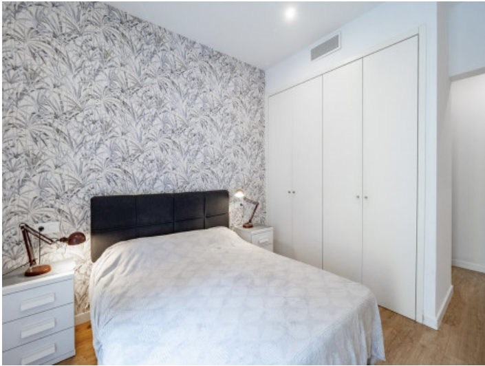
Eines von 2 Schlafzimmern